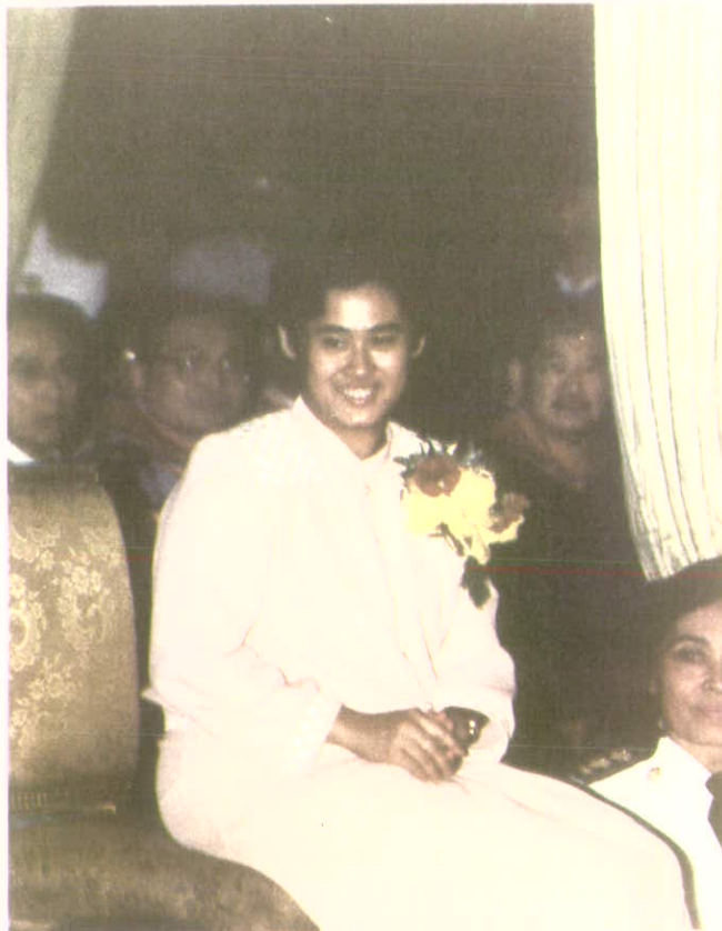
ทรงทอดพระเนตรการแสดงในวโรกาสที่มหาวิทยาลัยศรีนครินทรวิโรฒจัดถวาย เมื่อวันที่ 17 ธันวาคม 2529 เพื่อเฉลิมฉลองพระเกียรติที่ทรงสำเร็จการศึกษาดุษฎีบัณฑิต