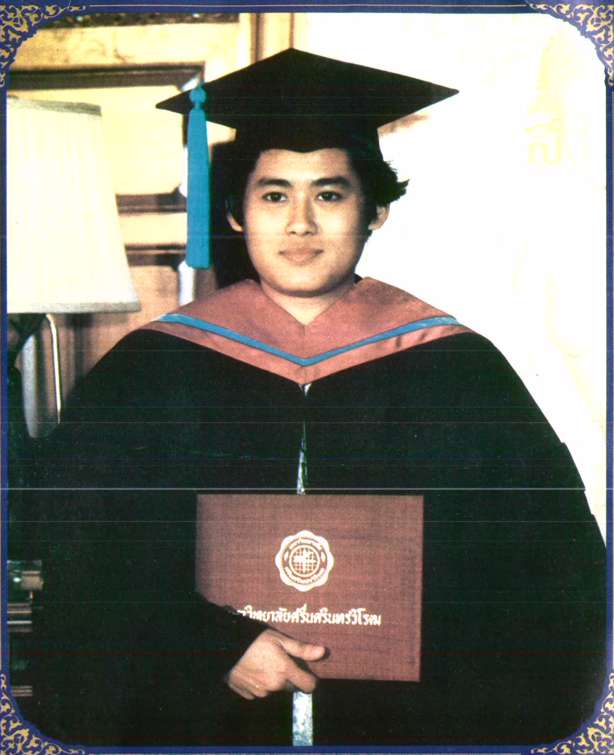
สมเด็จพะเทพรัตน์ราชสุดาฯ สยามบรมราชกุมารี ปริญญาการศึกษาดุขฎีบัณฑิต สาขาพัฒนศึกษาศาสตร์ มหาวิทยาลัยศรีนครินทรวิโรฒ