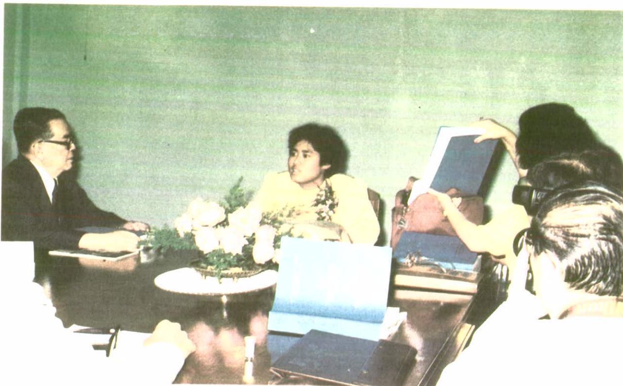
ทรงตอบคำถามในระหว่างสอบปากเปล่าปริญญาโท 6 ตุลาคม 2529

ด้วยพระปรีชาสามารถทรงสอบผ่านปริญญาโทได้ คะแนน "ผ่านอย่างยอดเยี่ยม"