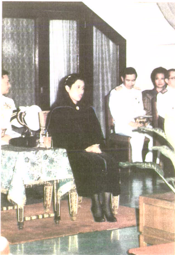
สมเด็จพระเจ้าลูกเธอ เจ้าฟ้าจุฬาภรณวลัยลักษณ์ อัครราชกุมารี เสด็จฯ ถวายช่อดอกไม้แสดงความปลื้มปิติยินดีในวโรกาสที่สมเด็จพระเทพรัตนราชสุดาฯ สยามบรมราชกุมารี ทรงสำเร็จปริญญาการศึกษาดุษฎีบัณฑิต สาขาพัฒนศึกษาศาสตร์