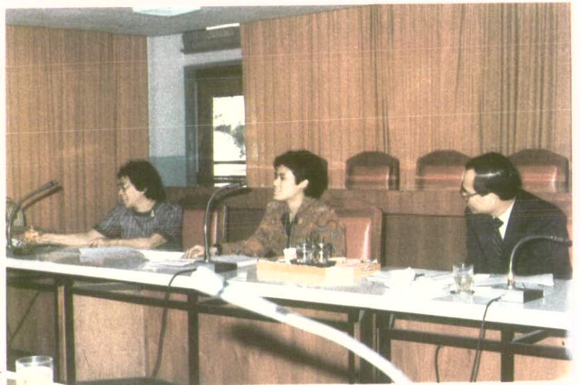
ขณะทรงเสนอเค้าโครงปริญญาบัตร