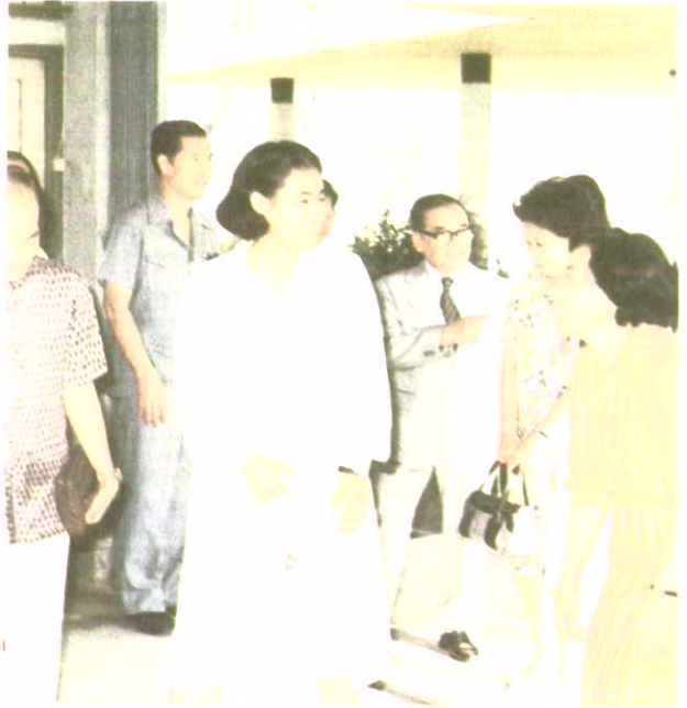
เสด็จฯ มาทรงสอบคัดเลือก