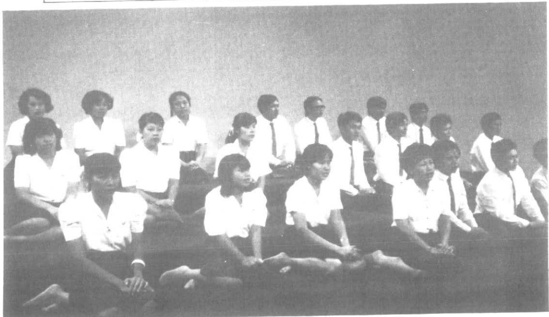
คณะนิสิตร่วมขับร้องเพลง "เทพมหাজกรี" ถวายสมเด็จพระเทพรัตนราชสุดาฯ สยามบรมราชกุมารี