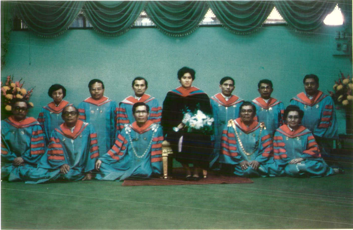
ทรงฉายร่วมกับนายกสภามหาวิทยาลัย อธิการบดี และกรรมการสภามหาวิทยาลัยศรีนครินทรวิโรฒ