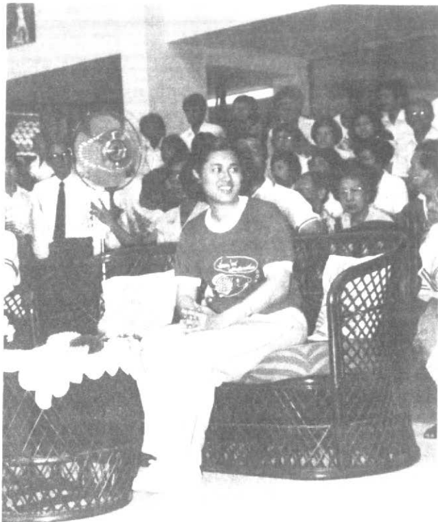
ทรงร่วมกิจกรรม "วันบัณฑิตสัมพันธ์"