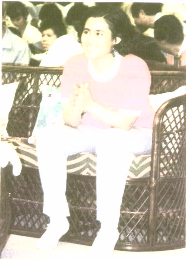
ทรงร่วมกิจกรรม "วันบัณฑิตสัมพันธ์" 23 พฤศจิกายน 2529