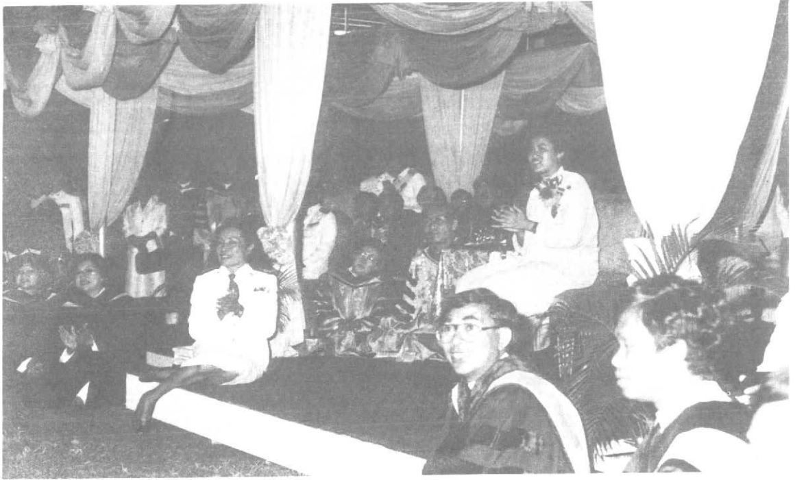
ทรงทอดพระเนตรการจุดพลุและดอกไม้ไฟเพื่อเฉลิมฉลองในวโรกาสอันเป็นมงคล ในวันที่ 17 ธันวาคม 2529 ณ มหาวิทยาลัยศรีนครินทรวิโรฒ

คณะกรรมการได้พิจารณาผลการสอบในด้านระเบียบวิธีวิจัย คุณค่าของเรื่องที่ทรงนิพนธ์ และพระปรีชาสามารถในการสอบแล้ว ลงมติให้ทรงสอบผ่านอย่างยอดเยี่ยม สภามหาวิทยาลัยศรีนครินทรวิโรฒ ได้อนุมัติให้ทรงสำเร็จการศึกษาตั้งแต่วันที่ 17 ตุลาคม 2529