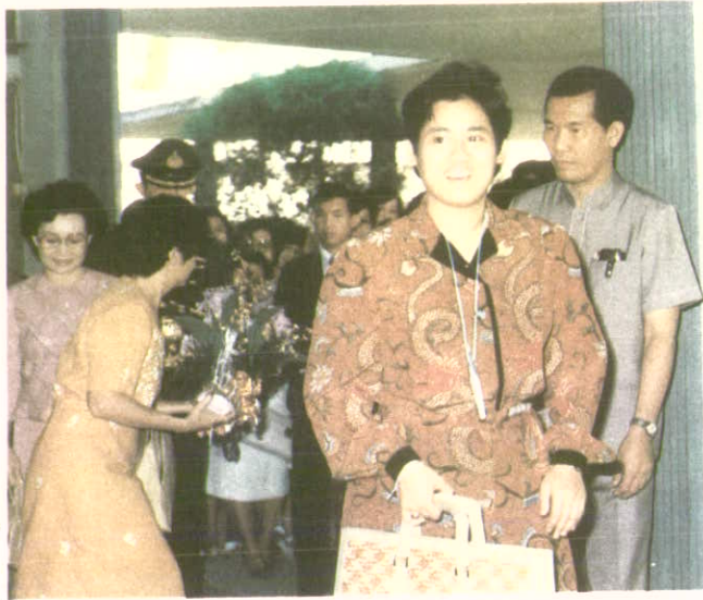
เสด็จฯ เสนอเค้าโครงปริญญาบัตร เมื่อวันที่ 9 มกราคม 2528