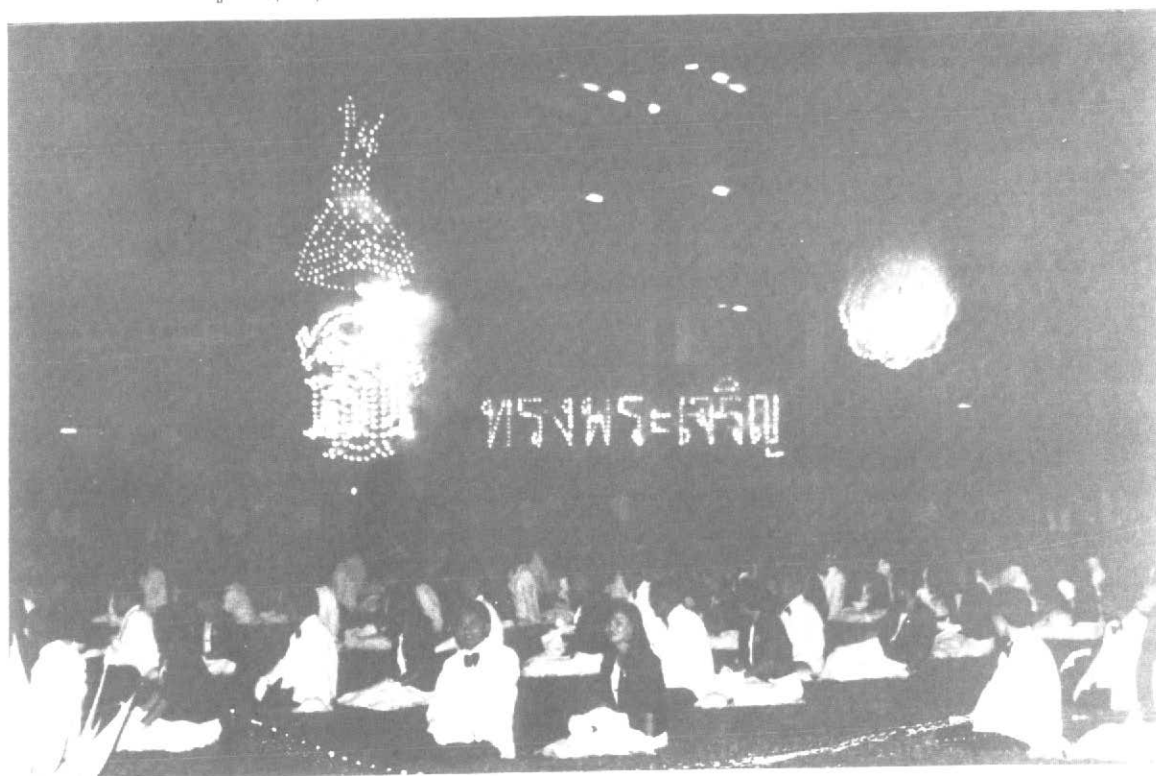
คณะนิสิตปัจจุบันร่วมกันแสดงและขับร้องเพลง "บัวแก้ว" ถวายสมเด็จพระเทพรัตนราชสุดาฯ สยามบรมราช กุมารี เพื่อเฉลิมฉลองในวโรกาสที่ทรงสำเร็จการศึกษาระดับดุขงุบัณฑิต

การสร้างและพัฒนา นวัตกรรมการนี้มีขั้นตอนสำคัญคือ ทรงศึกษาหลักสูตรภาษาไทยชั้นมัธยมศึกษา ตอนปลายโดยละเอียด ศึกษาสภาพปัญหาการเรียนการสอนภาษาไทยในระดับชั้นนี้จากเอกสารต่าง ๆ ที่ เกี่ยวข้อง และจากการประชุมครูสอนภาษาไทยในระดับชั้นมัธยมศึกษาตอนปลาย จำนวน 38 คน แล้วทรงนำ ข้อมูลที่ได้มาเป็นแนวทางในการสร้างนวัตกรรมการเสริมทักษะการเรียนการสอนภาษาไทยสำหรับนักเรียนชั้น มัธยมศึกษาตอนปลาย ประกอบด้วยบทเรียน 10 บท ซึ่งได้ทรงคัดเลือกเนื้อหาสาระที่มีความหลากหลาย มี แบบการประพันธ์ต่าง ๆ ทั้งร้อยแก้วและร้อยกรอง และได้ทรงให้คำอธิบายไว้อย่างละเอียด ถึงความเป็นมา และเรื่องราวของบทประพันธ์พร้อมกับอธิบายคำศัพท์ประกอบด้วย ในแต่ละบทเรียน ได้ทรงเสนอกิจกรรมการ เรียนหลายอย่างต่าง ๆ กัน เพื่อให้นักเรียนเรียนภาษาไทยด้วยความสนุกสนานเพลิดเพลิน รักการเรียนภาษาไทย และในขณะเดียวกันก็ได้ความรู้เพิ่มเติมในเรื่องที่สืบเนื่อง เช่น ขนบธรรมเนียม วัฒนธรรม ประเพณี ประวัติศาสตร์ ภูมิศาสตร์ วรรณคดี ทำให้นักเรียนมีความรู้เพิ่มเติมกว้างขวางยิ่งขึ้นนอกเหนือจากการเรียนตามหลักสูตร ต่อจากนั้นได้ขอให้ผู้ทรงคุณวุฒิและมีประสบการณ์ในการสอนภาษาไทยตรวจ แสดงความคิดเห็นและปรับปรุง