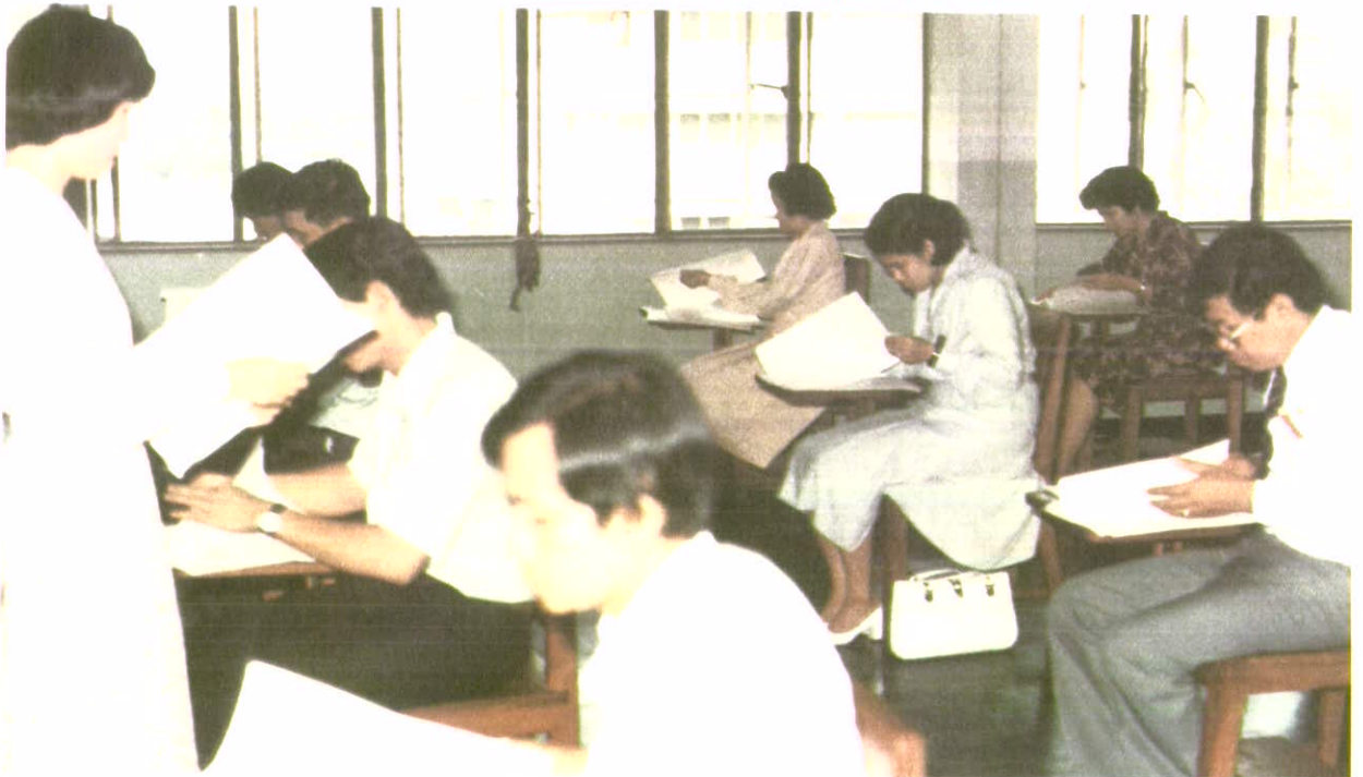
ประทับ ณ โต๊ะสอบคัดเลือก