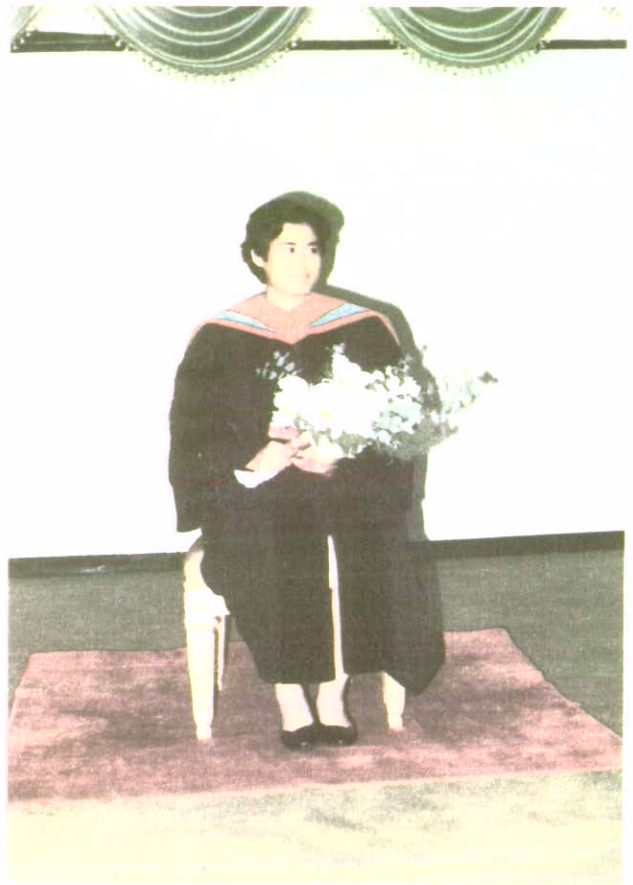
ทรงสำเร็จการศึกษาดุษฎีบัณฑิต สาขาวิชาพัฒนศึกษาศาสตร์ มหาวิทยาลัยศรีนครินทรวิโรฒ