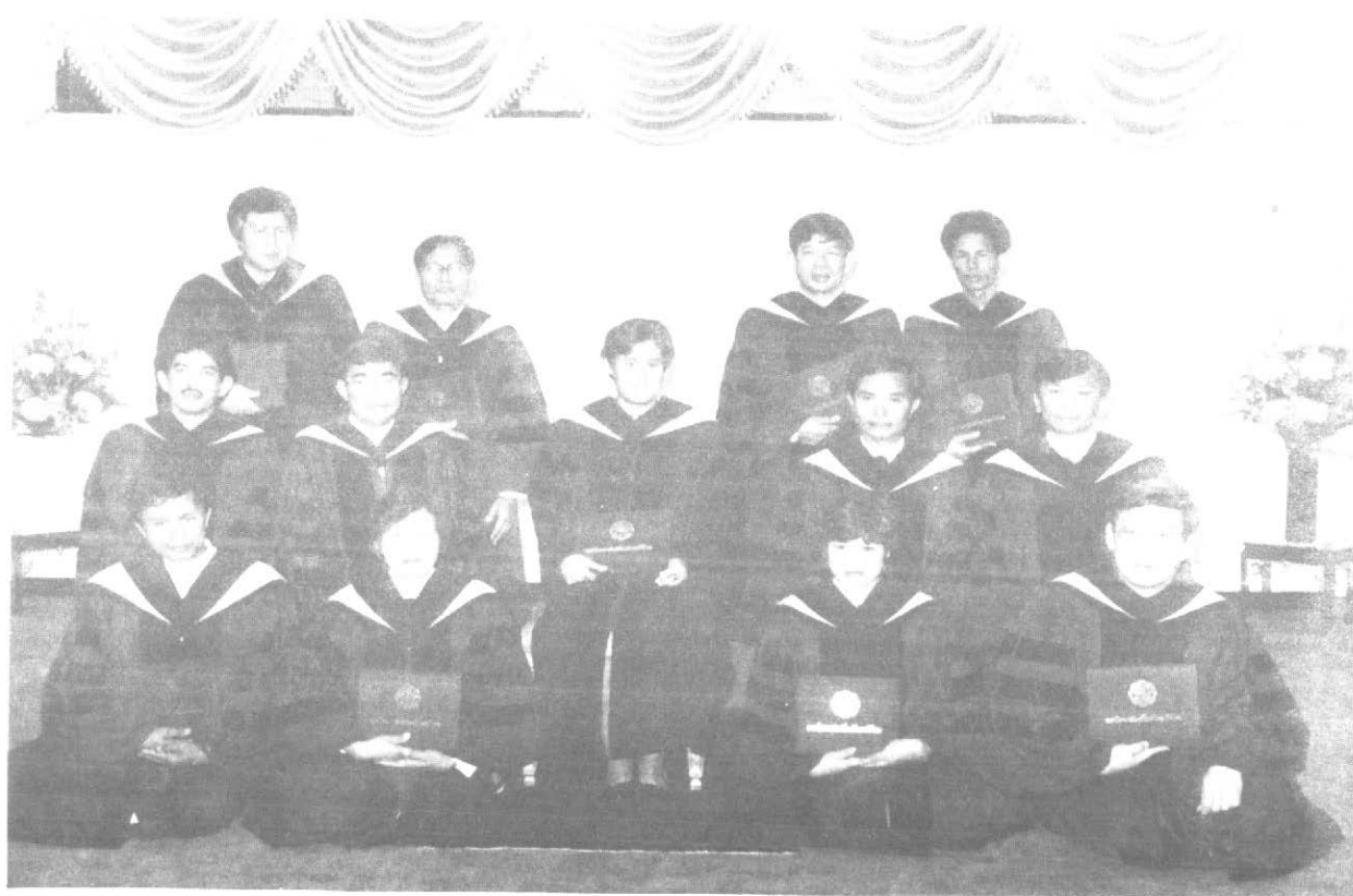
ทรงฉายร่วมกับพระสหายร่วมรุ่น “พัฒนศึกษาศาสตร์” เมื่อวันที่ 18 ธันวาคม 2529

เหตุผลที่ทรงเลือกทำปริญญาานิพนธ์เรื่องนี้ ก็เนื่องมาจากการที่ทรงสนพระทัยในการจัดการศึกษา เพื่อพัฒนาทรัพยากรมนุษย์ของประเทศไทย ทรงตระหนักว่าภาษาเป็นเครื่องแสดงเอกลักษณ์ของชาติและเป็นเครื่องมือสื่อสารถ่ายทอดศิลปวิทยาการและวัฒนธรรม ซึ่งเป็นมรดกตกทอดอันล้ำค่าของชาติ การมีทักษะในการเข้าใจและใช้ภาษาไทยได้เป็นอย่างดีจึงมีความสำคัญอย่างยิ่งสำหรับชนชาวไทย อนึ่ง ในปัจจุบันนี้ปรากฏว่าสภาพการเรียนการสอนภาษาไทยมีปัญหา กล่าวคือ นักเรียนไม่ค่อยสนใจเรียนภาษาไทย และมีความรู้ความสามารถและทักษะในการเข้าใจและใช้ภาษาไม่เพียงพอ ด้วยเหตุนี้จึงทรงนำเสนอวิธีการสอนภาษาไทยในลักษณะนวัตกรรมเสริมทักษะการเรียนการสอน ซึ่งเป็นวิธีการที่จะส่งเสริมความสนใจการเรียนภาษาไทยของนักเรียนสถานหนึ่ง และเป็นสื่อที่จะช่วยครูให้สอนง่ายขึ้นอีกสถานหนึ่ง อีกทั้งจะช่วยเพิ่มพูนความรู้ความสามารถในวิชาภาษาไทย ตลอดจนความรู้สืบเนื่องต่าง ๆ ได้ด้วย