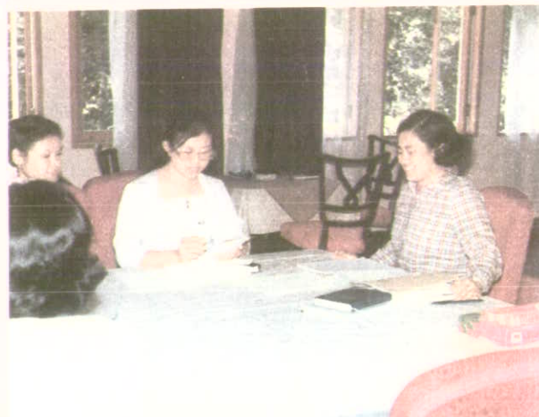
เสด็จ มาทรงพระอักษร ห้อง 955 ที่บัณฑิตวิทยาลัย ทรงติวกับพระสหาย เพื่อเตรียมสอบเบื้องต้น