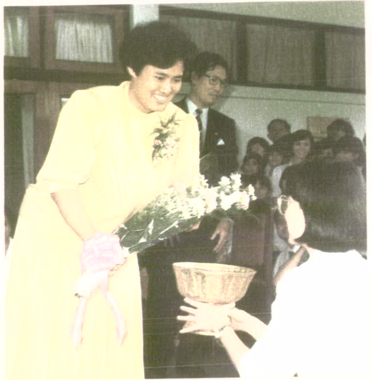
ผู้แทนนิสิตทูลเกล้าฯ ถวายช่อดอกไม้

ทรงฉายร่วมกับคณาจารย์ของมหาวิทยาลัยศรีนครินทรวิโรฒ ประสานมิตร ที่เข้าเฝ้าฯ แสดงความปิติยินดี