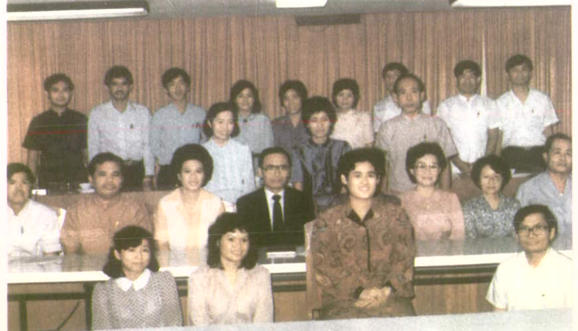
ทรงฉายกับพระอาจารย์ ของบัณฑิตวิทยาลัยและพระสหาย