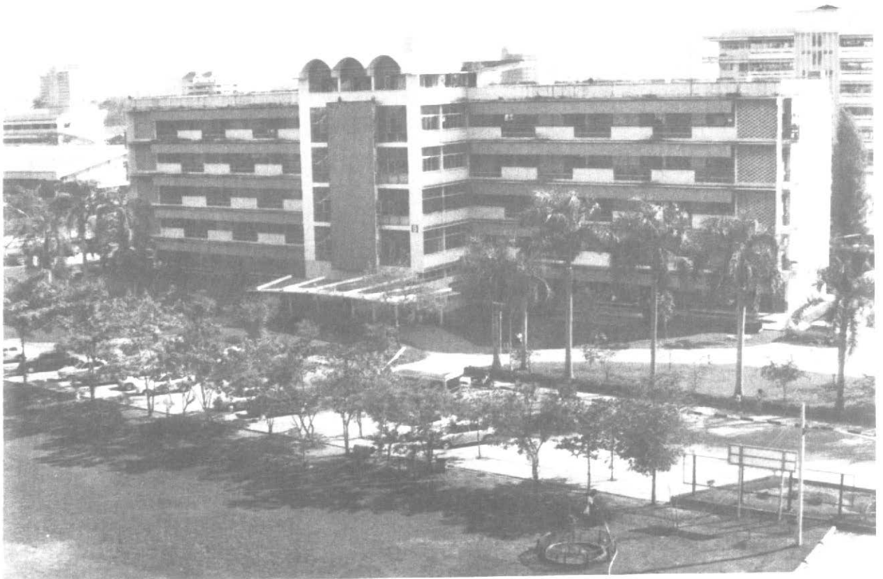
ตึก ๑ ซึ่งเป็นอาคารเรียนของนิสิตปริญญาเอก