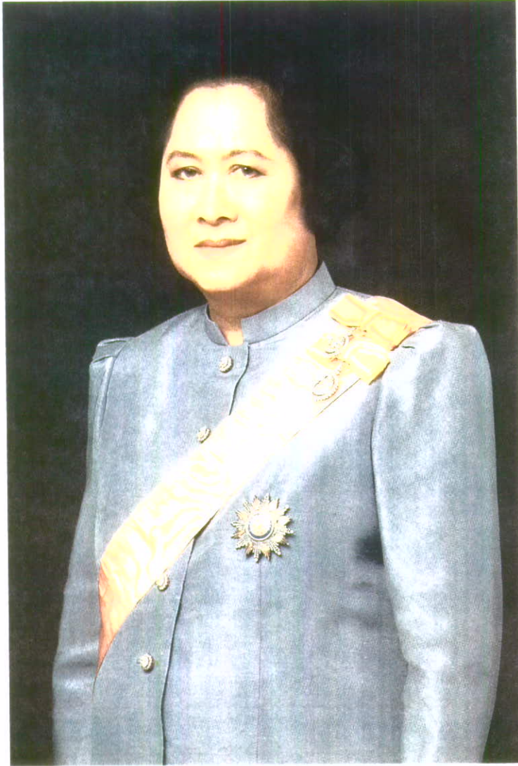
สมเด็จพระเจ้าพี่นางเธอ เจ้าฟ้ากัลยาณิวัฒนา กรมหลวงนราธิวาสราชนครินทร์ ปริญญายาบาลศาสตรดุษฎีบัณฑิตกิตติมศักดิ์ สาขาวิชาพยาบาลศาสตร์