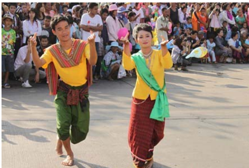
ภาพประกอบ 6 การแต่งกายของชายและหญิงในการแสดงแบบอนุรักษ์

17 พฤศจิกายน 2555