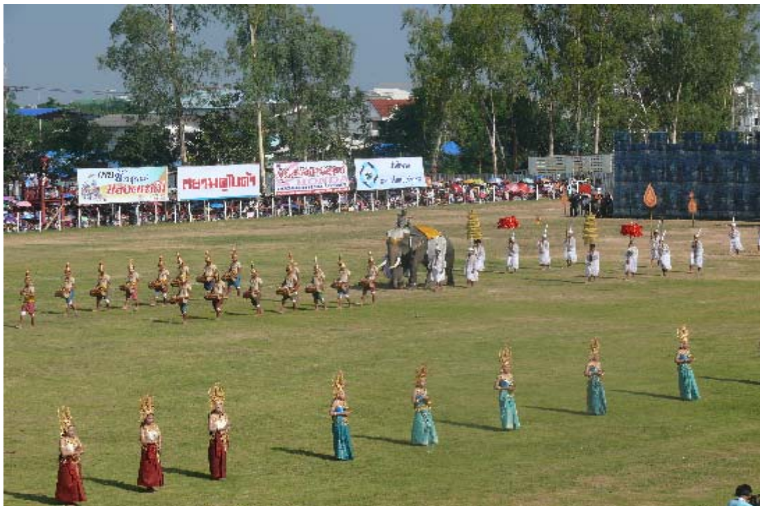
ภาพการแสดงรำอัปสรสราญในงานแสดงช้างประจำปี 2555 ณ สนามแสดงช้าง จังหวัดสุรินทร์