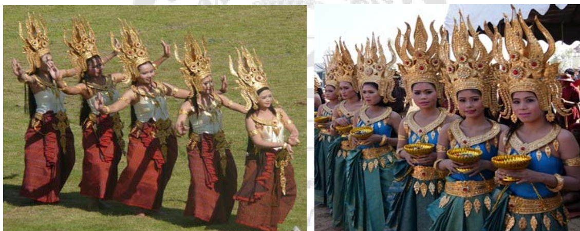
ภาพประกอบ 1 การแต่งกายของนักแสดงชุดอัปสรธราญ

6. การนำพิธีไหว้ครูมาปรับเป็นชุดการแสดง โดยนำบทเพลงที่มีเนื้อหาเกี่ยวกับการไหว้ครูมาประกอบเข้ากับการฟ้อนรำเป็นชุดการแสดงไหว้ครู เช่น เพลงบวรอัปสรหรืออัปสรธราญ ซึ่งมีเนื้อหาในการกล่าวบูชาครู โดยมีนักฟ้อนรำหญิงประมาณ 4-6 คน แต่งกายสวยงามคล้ายนางอัปสรฟ้อนรำประกอบเพลงด้วยท่วงท่าที่ประดิษฐ์ขึ้น โดยได้ต้นแบบมาจากภาพประติมากรรมในปราสาทต่างๆ เช่น ปราสาทภูมิปอน ปราสาทบ้านพลวง ปราสาทเขาพนมรุ้ง ซึ่งมีความอ่อนช้อย สวยงาม และพร้อมเพรียงกัน