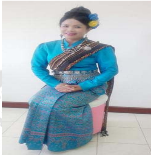
ภาพประกอบ 4 การแต่งกายของนักร้องหญิงในการแสดงกันตรึมแบบโบราณ

2. นักร้อง ไม่ว่าจะเป็นหญิงหรือชาย ก็แต่งกายด้วยชุดที่ตัดเย็บจากผ้าไหม ผู้หญิงสวมเสื้อที่ตัดเย็บจากผ้าไหมลวดลายสีล้วนสวยงามอาจเป็นคอกกลมหรือคอวี แขนสั้นหรือแขนยาวเข้าชุดกับกระโปรงยาวถึงข้อเท้า อาจสวมรองเท้าหรือไม่ก็ได้ แต่งหน้าและใช้เครื่องประดับมากน้อยตามความเหมาะสม ส่วนผู้ชายสวมเสื้อทรงซาฟารีตัดเย็บจากผ้าไหมลวดลายต่างๆ สวมกางเกงผ้าไหมลายเรียบๆ สวมรองเท้านักเดินป่า