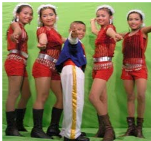
ภาพประกอบ 7 การแต่งกายของนักร้องและวงเครื่องในการแสดงแบบประยุกต์

22 สิงหาคม 2552