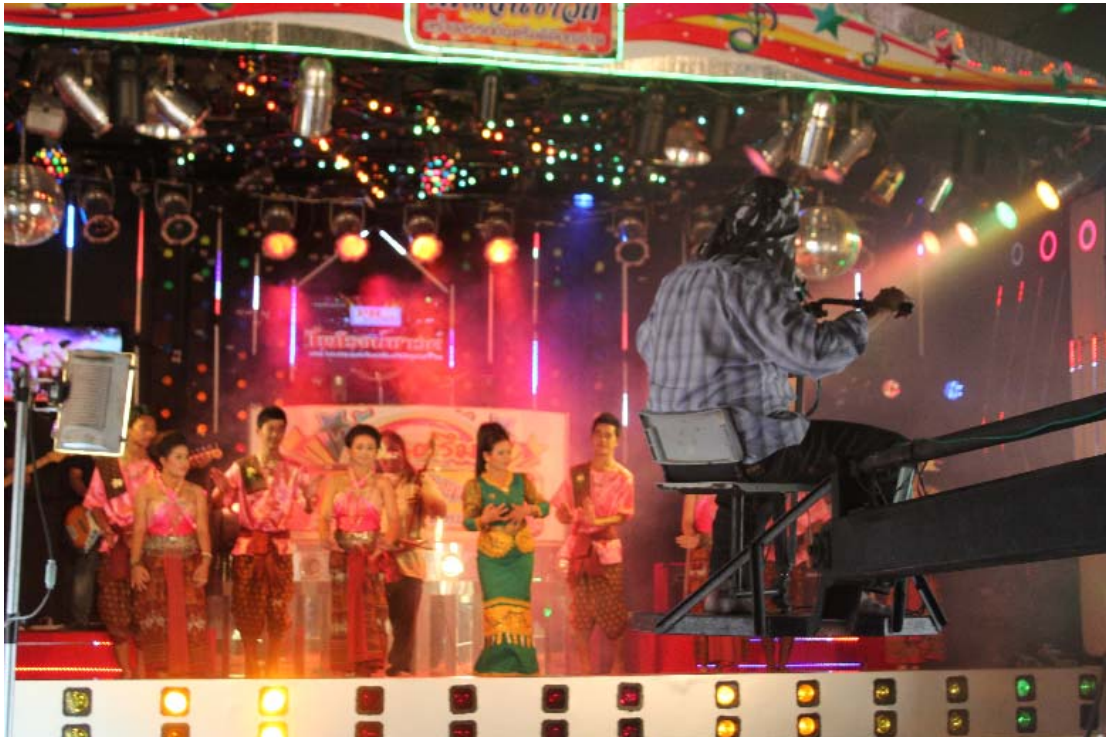
ภาพขณะทำการบันทึกภาพและเสียงในรูปแบบคาราโอเกะ