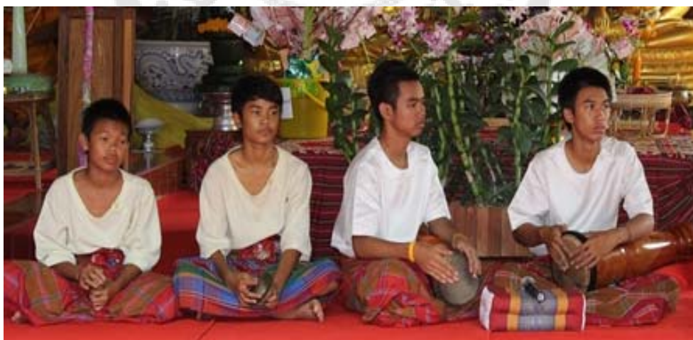
ภาพประกอบ 3 การแต่งกายของนักดนตรีในการแสดงกันตรึมแบบโบราณ

1. นักดนตรี นักดนตรียังคงเป็นชายล้วน มีรูปแบบการแต่งกายที่เป็นแบบแผนเหมือนกันทุกคน คือ สวมเสื้อคอกลมสีขาวไม่มีลวดลาย หรือเสื้อคอกลมผ้าหน้าคล้ายเสื้อม่อฮ่อม นุ่งผ้าโสร่งลายตาราง คาดเอวด้วยผ้าขาวม้า