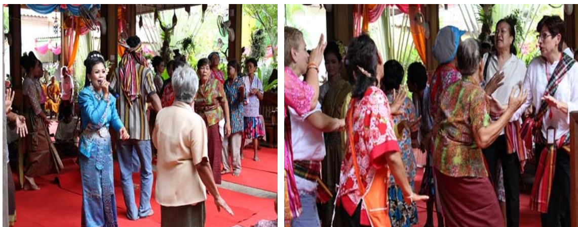
ภาพประกอบ 2 การสร้างปฏิสัมพันธ์กับผู้ชมให้ออกมาร่วมสนุก

6 กันยายน 2556