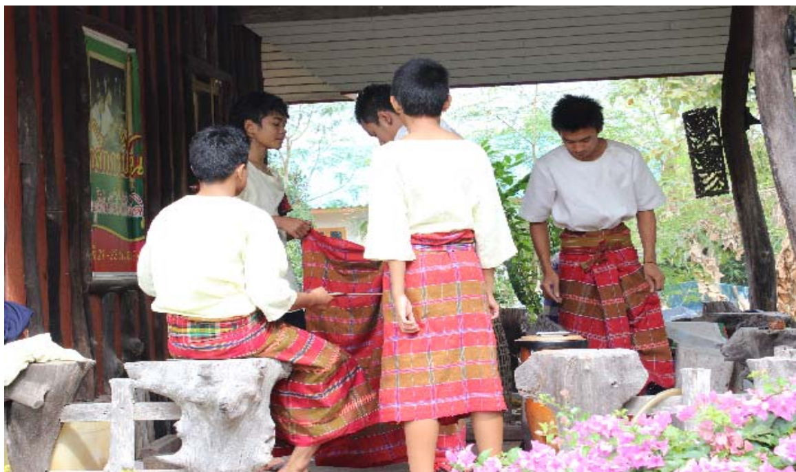
ภาพกลุ่มนักดนตรีกำลังช่วยกันแต่งกายเพื่อเตรียมแสดง