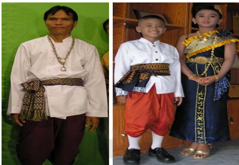
ภาพประกอบ 5 การแต่งกายของนักร้องชายและหญิงในการแสดงแบบอนุรักษ์

6 กันยายน 2556