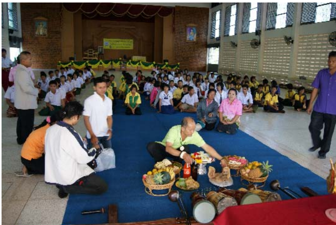
ภาพการเตรียมเครื่องบูชาครูเพื่อใช้ประกอบพิธีไหว้ครู