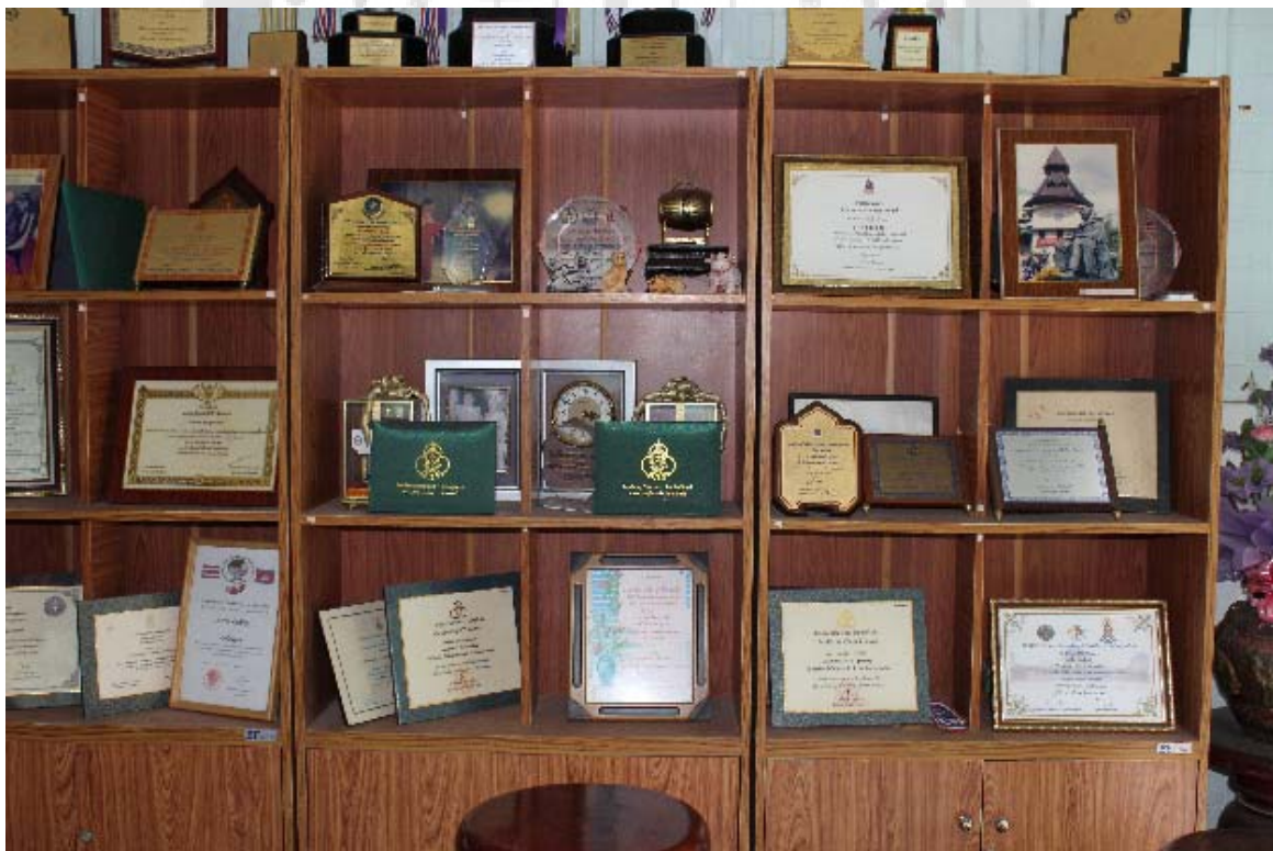
ภาพแสดงรางวัลที่คณะน้ำผึ้ง เมืองสุรินทร์ได้รับจากการประกวดแข่งขัน