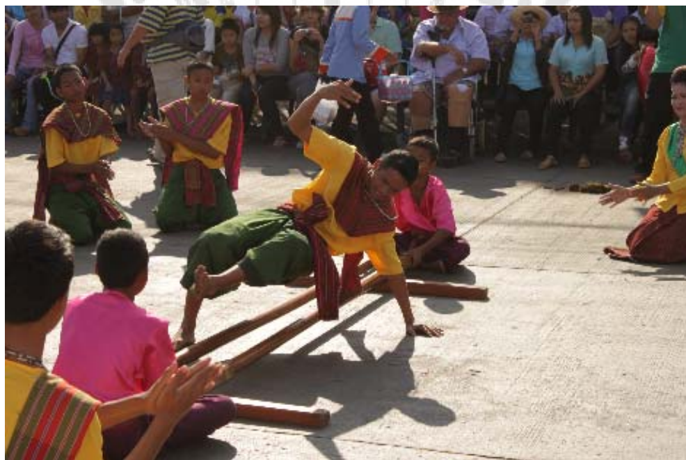
ภาพการแสดงเว็มอันเรหรือรำสาก