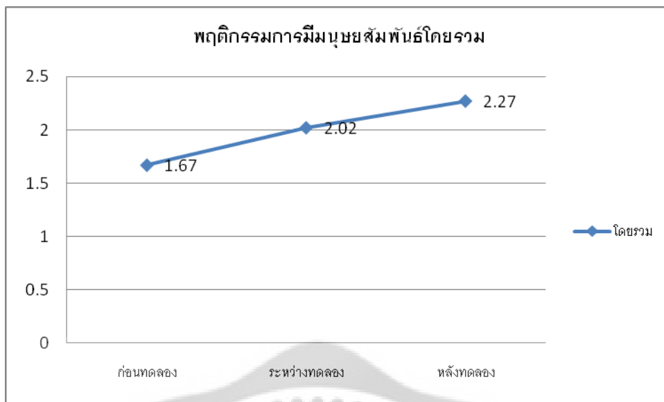
ภาพประกอบ 3 เส้นภาพการวิเคราะห์การเปลี่ยนแปลงพฤติกรรมการมีมนุษย์สัมพันธ์โดยรวม