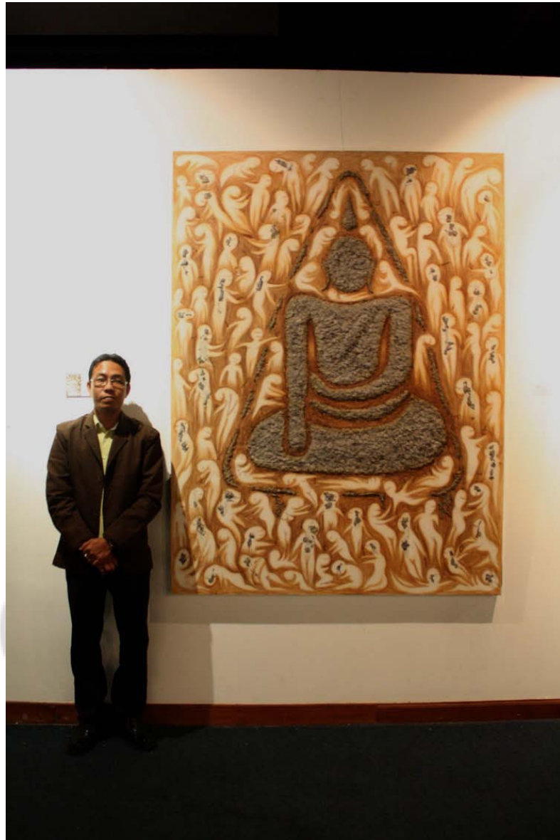
ภาพบรรยากาศการแสดงนิทรรศการ