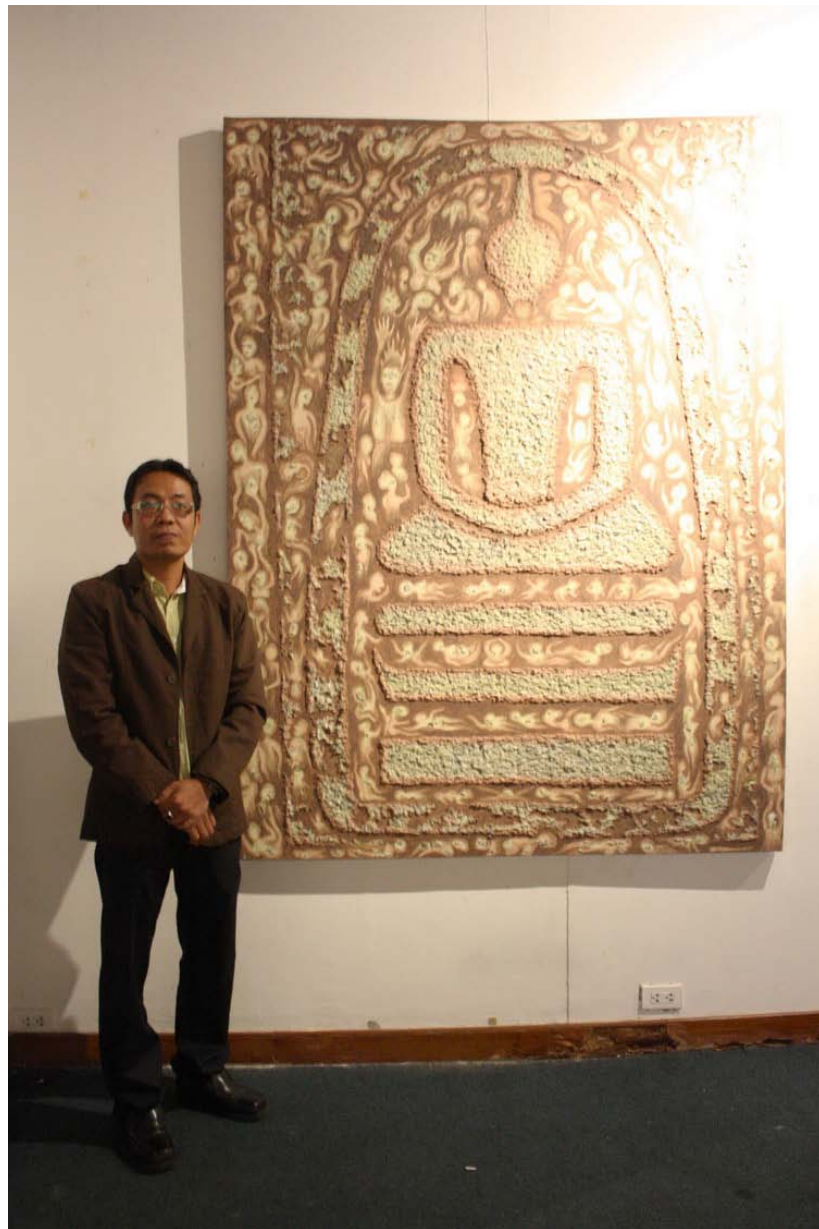
ภาพบรรยากาศการแสดงนิทรรศการ