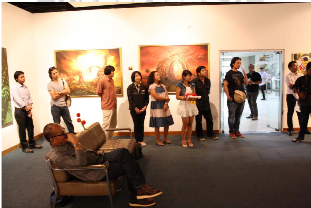
ภาพบรรยากาศการแสดงผลงานนิทรรศการ