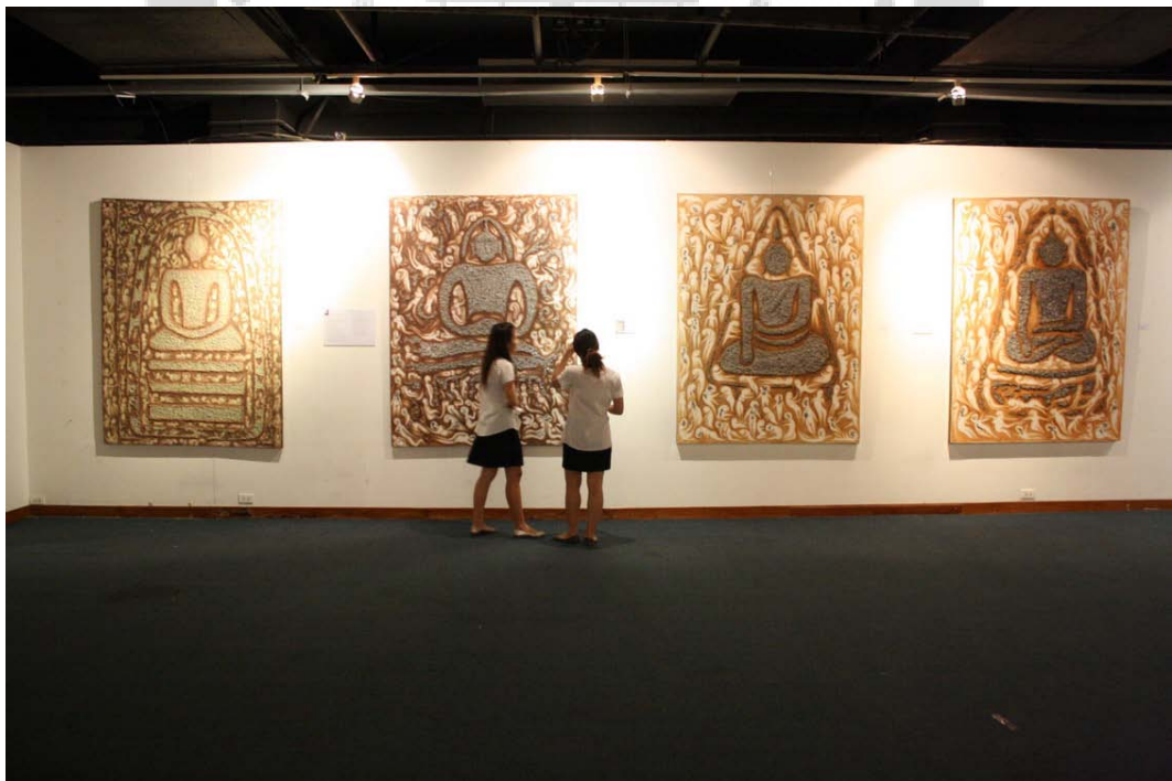
ภาพบรรยากาศการแสดงผลงานนิทรรศการ