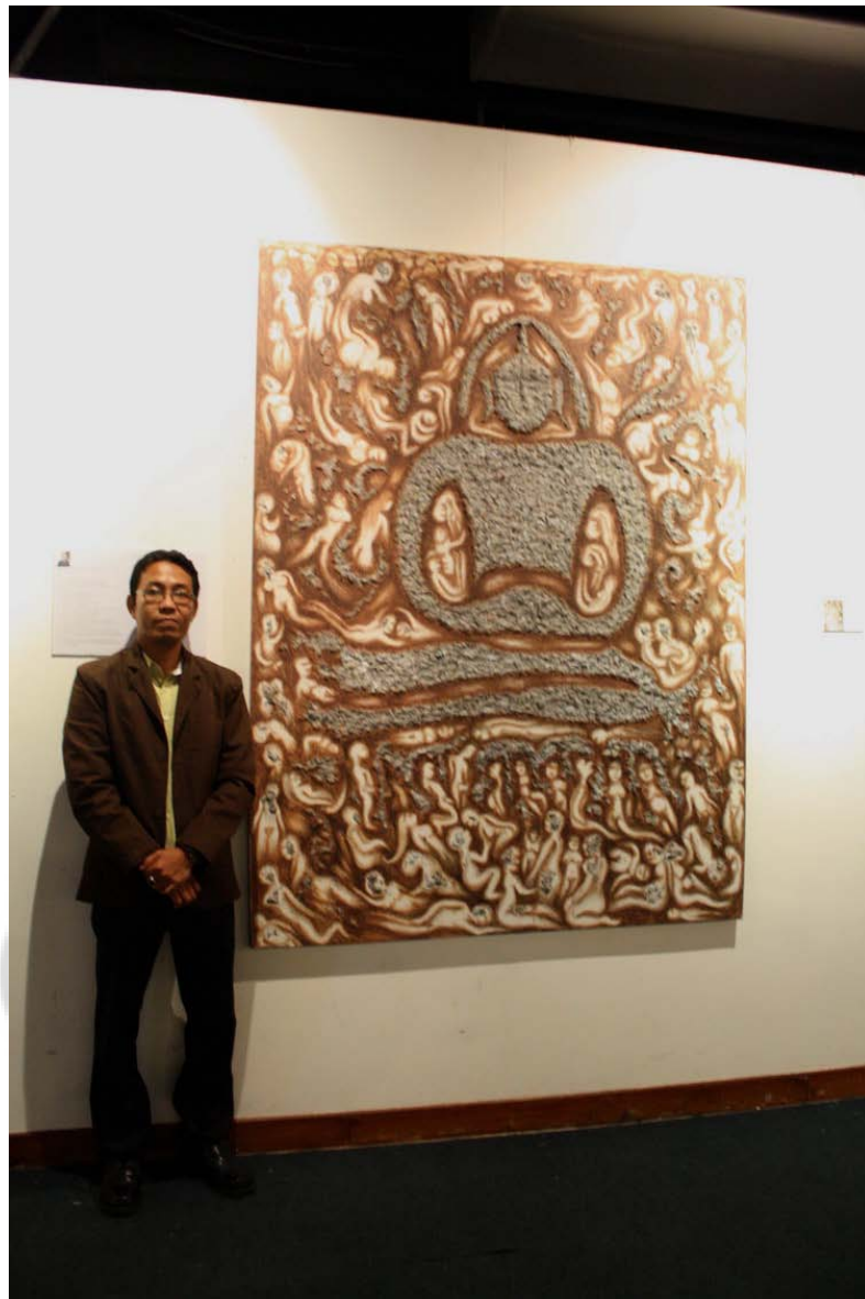
ภาพบรรยากาศการแสดงผลงานนิทรรศการ