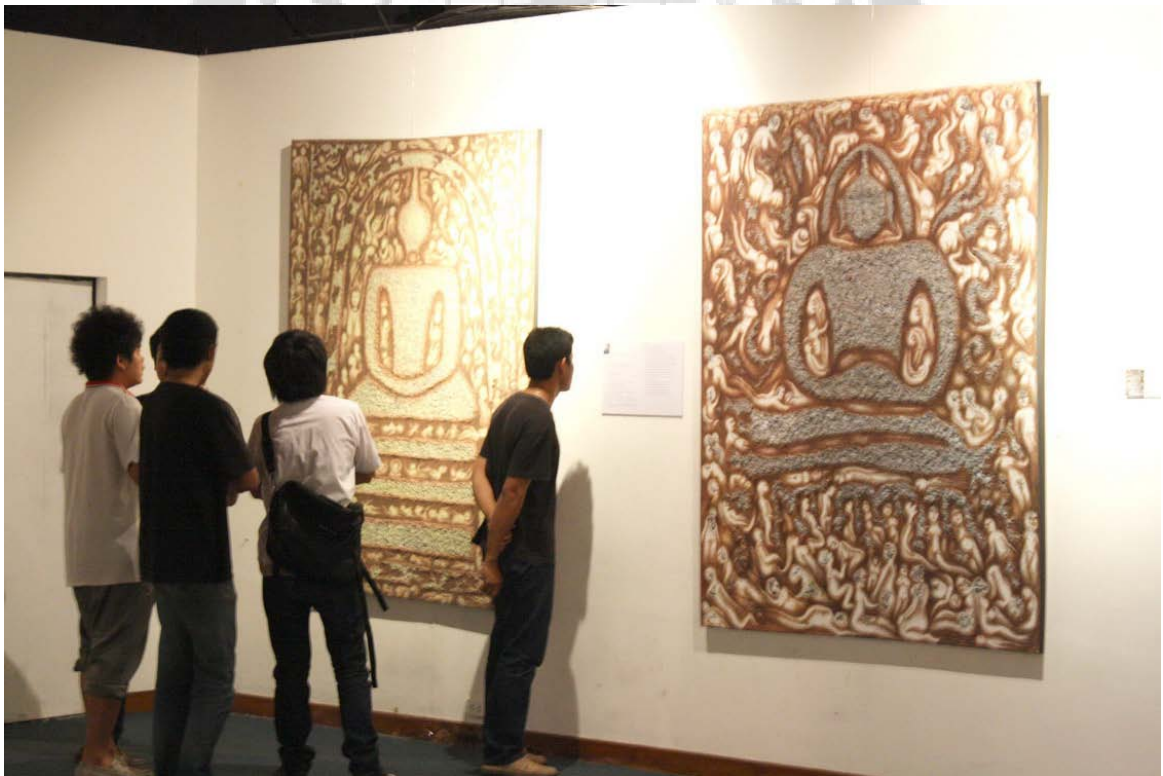
ภาพบรรยากาศการแสดงผลนิทรรศการ