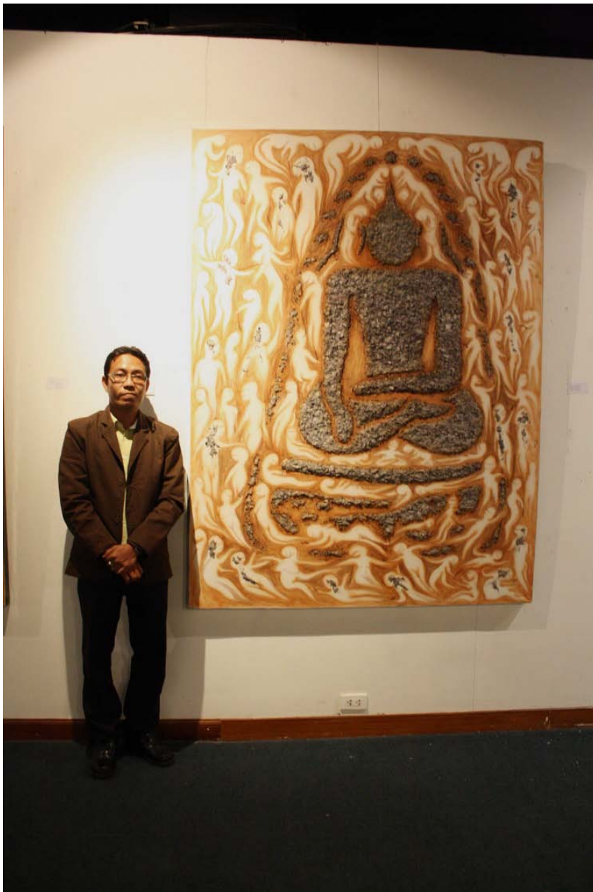
ภาพบรรยากาศการแสดงผลนิทรรศการ