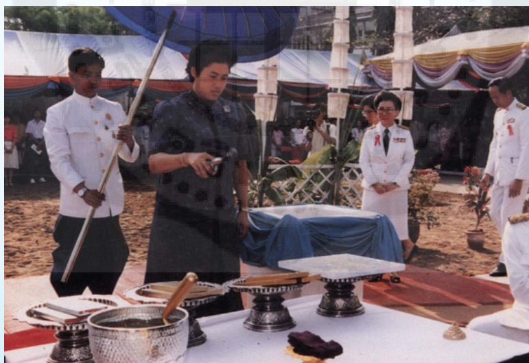
สมเด็จพระเทพรัตนราชสุดาฯ เสด็จพระราชดำเนินมาทรงวางศิลาฤกษ์ "อาคารสมเด็จพระเทพรัตนราชสุดาฯ" เมื่อวันที่ ๙ กุมภาพันธ์ ๒๕๓๐

พ.ศ. 2528 - 2532 ได้สร้างอาคารสำนักหอสมุดกลางหลังปัจจุบัน และได้ขอพระราชทานพระนามาภิไธย "สมเด็จพระเทพรัตนราชสุดาฯ" อัญเชิญจารึกเป็นชื่ออาคาร เป็นอาคารสูง 7 ชั้น พื้นที่ 10,200 ตารางเมตร เก็บหนังสือ ได้ประมาณ 300,000 เล่ม ที่นั่งอ่านประมาณ 1,200 ที่นั่ง