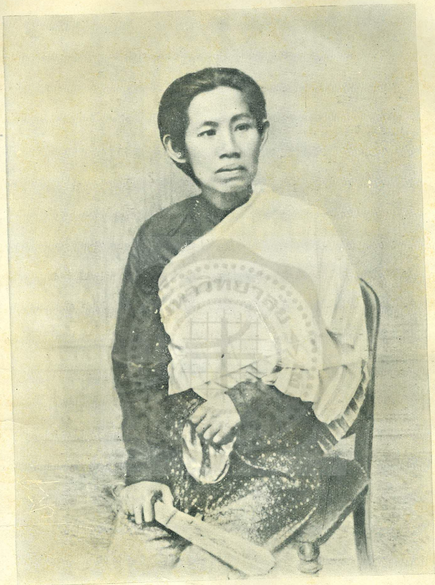
ท้าววรจันทร์ (เจ้าจอมมารตาชาติ พระสนมเอก รัชกาลที่ ๔) ถ่ายเมื่อ พ.ศ. ๒๔๒๕ อายุ ๔๕ ปี