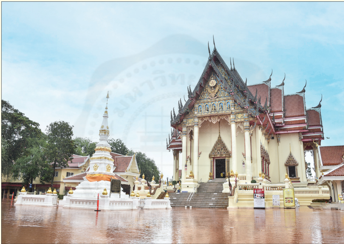
เจตีย์พระธาตอรหันต์