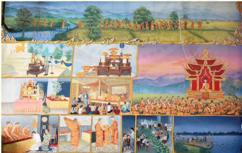
จิตรกรรมฝาผนัง เทศกาลแข่งเรือยาวและบั้งไฟพญานาค