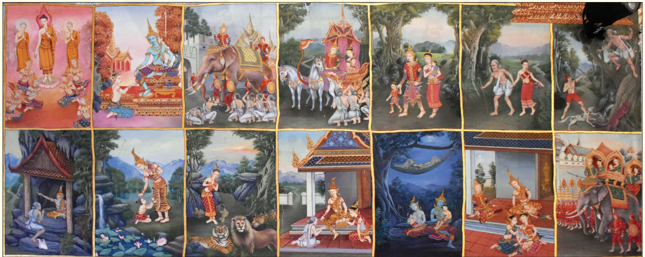
จิตรกรรมฝาผนัง พุทธประวัติ