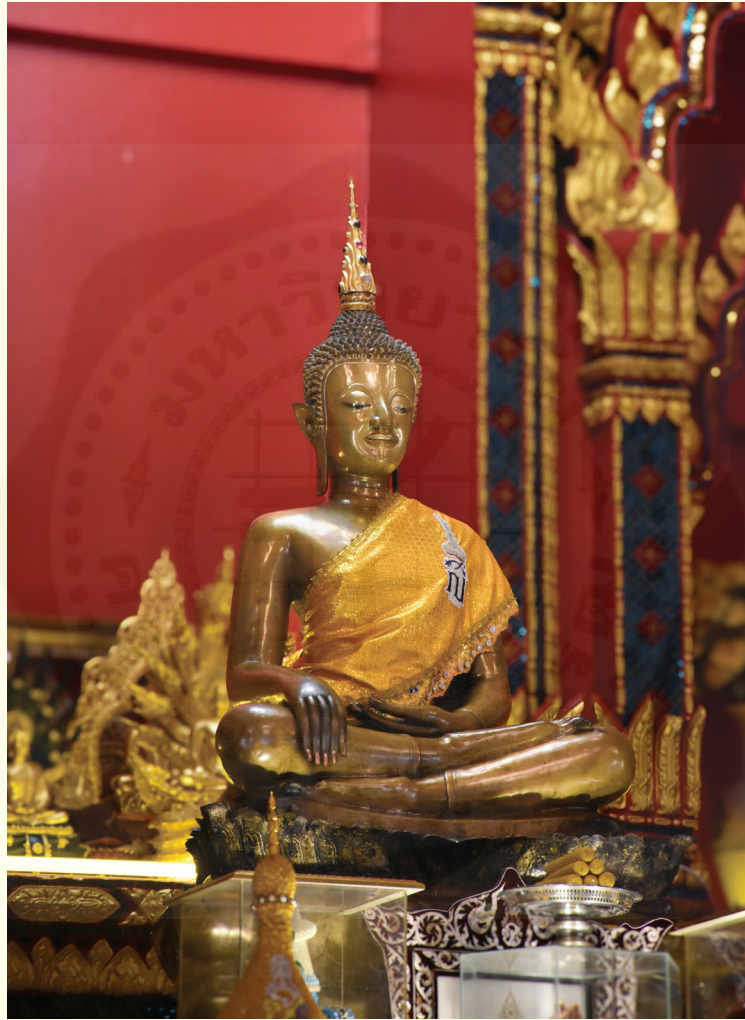
หลวงพ่อพระใส