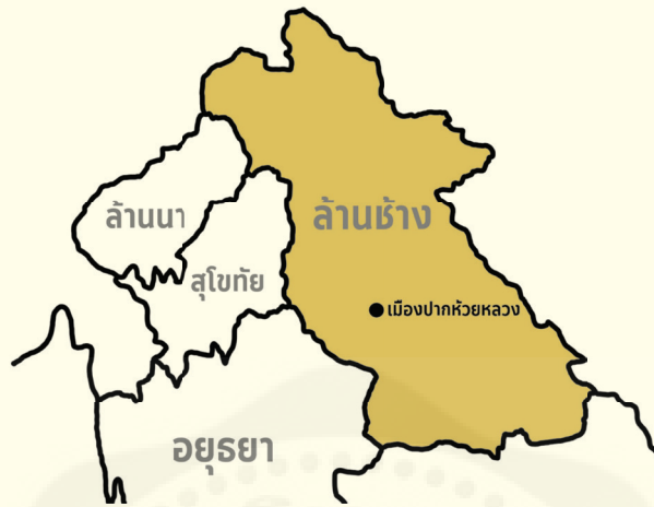
แผนที่แสดงเมืองปากห้วยหลวง ในสมัยล้านช้าง บริเวณจังหวัดหนองคายในปัจจุบัน

หลังจากนั้นเมืองปากห้วยหลวงก็ค่อย ๆ ลดความสำคัญลง คาดว่าเพราะการวิวาทกันภายในราชวงศ์ล้านช้าง ตั้งแต่พระบรมราชาแห่งนครพนม พระราชโอรสพระเจ้านันทราชกรีธาทัพมาปราบ เจ้าไชยองค์เว้ พ.ศ. ๒๒๔๑ ถึงเมืองคุกชายฟอง (ตำบลเวียงคุก - บ้านทรายฟอง) กวาดต้อนผู้คนกลับไปและในปีถัดมา พ.ศ. ๒๒๔๒ พระเจ้านันทราชกรีธาขบถกลับ จากเจ้าองค์หล่อและยึดเมืองเวียงจันทน์ได้สำเร็จ ความขัดแย้งภายในหมู่ชนชั้นสูงของล้านช้างนำมาซึ่งความเสื่อมถอยลงของเมืองปากห้วยหลวงในฐานะเมืองลูกหลวง ต่อมาบริเวณจังหวัดหนองคาย ได้มีกลุ่มผู้คนอพยพมาตั้งชุมชนและเมืองขึ้นเป็นกลุ่มใหญ่ ๆ และสำคัญอยู่ ๒ กลุ่ม สืบเนื่องมาจากเหตุการณ์ พ.ศ. ๒๒๕๐ สมเด็จพระเจ้าบรมวงศ์เธอเจ้าฟ้ากรมพระยานุรักษ์ (ญาคูขี้หอม) อพยพคนไปซ่อมพระธาตุพนมครั้งที่ ๔ ล่องเรือไปจนถึงอาณาจักรล้านช้างจำปาศักดิ์ เมื่อญาคูขี้หอมอพยพผู้คนไปทางใต้นั้น ศิษย์เอกสำคัญท่านหนึ่ง คือ อาจารย์แก้ว หรือ เจ้าแก้วมงคล (เจ้าแก้วบุลม บุษม) ได้ตั้ง “เมืองทุ่ง” (ทุ่ง) หรือ เมืองสุวรรณภูมิ (อำเภอสุวรรณภูมิ จังหวัดร้อยเอ็ด) เป็นเมืองด่านหน้า ยื่นกับเวียงจันทน์ เชื้อสายของท่านได้แยกย้ายสร้างบ้านแปลงเมืองหรือปกครองเมืองมากมาย เช่น จังหวัดร้อยเอ็ด มหาสารคาม ขอนแก่น เป็นต้น และภายหลังกลุ่มพระวอ และพระตา ผู้เป็นเสนาบดีผู้ใหญ่ในราชสำนักเวียงจันทน์ มีความขัดแย้งกับพระเจ้าสิริบุญสาร ด้วยสาเหตุไม่แจ้งชัด ได้พาเอาไพร่พลกองครัวญาติพี่น้อง อพยพหนีจากเวียงจันทน์ไปตั้งเมืองอยู่ที่หนองบัวลำภู และถอยร่นลงไปยังดอนมดแดงและตั้งเป็นจังหวัดอุบลราชธานี ยโสธร อำนาจเจริญ เป็นต้น ที่กล่าวถึงกลุ่มเจ้าจารย์แก้วและกลุ่มพระวอพระตา เนื่องจากทั้ง ๒ กลุ่มล้วนมีบทบาทสำคัญในการก่อสร้างเมืองต่าง ๆ ภายในจังหวัดหนองคายในปัจจุบัน