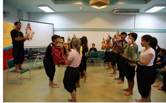
ภาพที่ 10 การประดิษฐ์หุ่่นกระบอกจิ๋ว