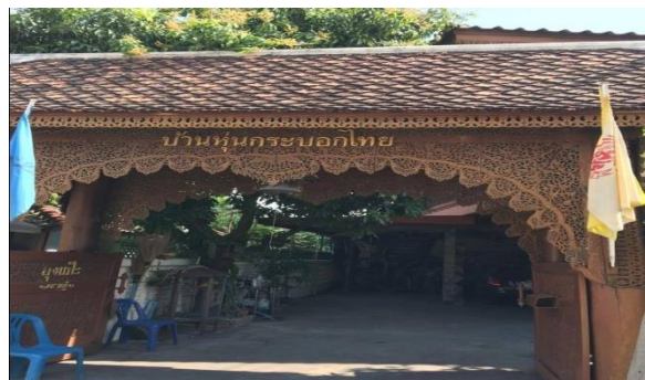
ภาพที่ 3 บ้านตุ๊กกะตุน หนุ่กระบอกไทย