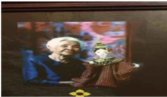
ภาพที่ 4 ครูชูศรี สกุลแก้ว

... มาถึงจุดเปลี่ยน คือ ลูกค้าที่มาซื้อหุ่นกระบอกถามว่าเจ็ดยังงัย ทำไงดีเราเจ็ดไม่เป็น เลยอ่านหนังสือใครเจ็ดหุ่นบ้าง เจอชื่อคุณยายขึ้น สกุลแก้ว ศิลปินแห่งชาติในการเจ็ดหุ่นกระบอกไทย เป็นปรมาจารย์ด้านนี้เลย ต้องไปหาคุณยายและต้องไปเรียนให้ได้ ซึ่งตอนนั้นท่านอายุได้ 90 ปีแล้ว