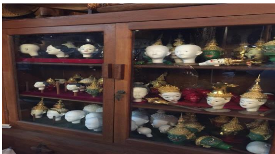
ภาพที่ 6 ชิ้นส่วนของหุ่นกระบอก

บ้านตุ๊กกะตุ่นฯ ได้จัดทำนิทรรศการเพื่อเผยแพร่องค์ความรู้เกี่ยวกับข้อมูลหุ่นกระบอก (ดังภาพที่ 5) โดยตั้งไว้ในบริเวณที่เปิดเป็นแหล่งการเรียนรู้ด้านหุ่นกระบอกไทย ในขณะเดียวกันได้จัดแสดงชิ้นส่วนของหุ่นกระบอก รวมถึงหุ่นกระบอกที่ใช้ในการแสดงชุดต่าง ๆ (ดังภาพที่ 6 และภาพที่ 7) เช่น พันท้ายนรสิงห์ พระสุธรมโนราห์ แม่นาคพระโขนง พระเนมิราชชาตก