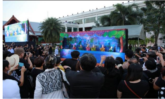
ภาพที่ 8 การแสดงที่ศูนย์การค้าเทอร์มินัล 21