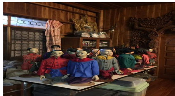
ภาพที่ 7 หุ่นกระบอกที่ใช้ในการแสดง

นอกจากนี้บ้านตุ๊กกะตุ่นฯ ยังได้ออกแสดงหุ่นกระบอกไทยตามสถานที่ต่าง ๆ ทั้งในหน่วยงานราชการและเอกชน โดยไม่หวังผลกำไร และมุ่งหวังให้คนทั่วไปรู้จักหุ่นกระบอกไทยมากขึ้น ดังผู้ให้ข้อมูลคนที่ 8 กล่าวว่า “ทุกวันนี้หุ่นกระบอกไม่มีกำไรนะ เล่นให้ราชการและเอกชน เราต้องเตรียมฉากอุปกรณ์ไปเองหมด งานต่าง ๆ ขาดทุนนะ” (ดังภาพที่ 8 และภาพที่ 9)