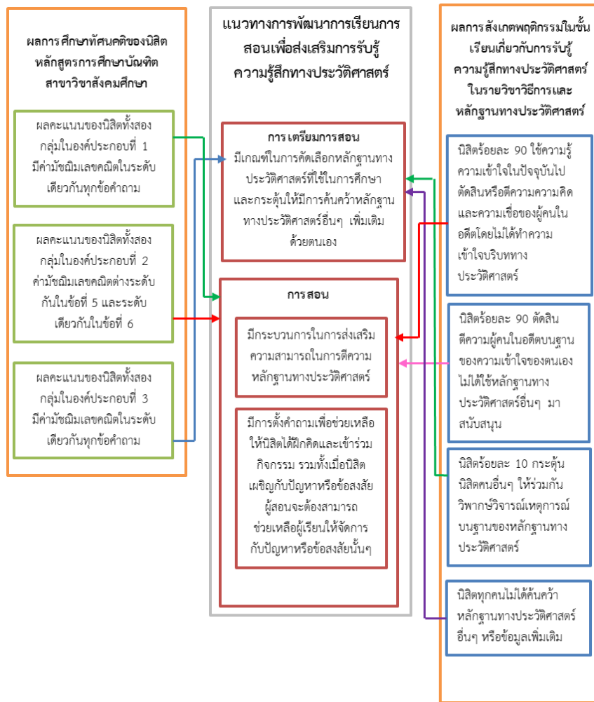
ภาพที่ 3 แนวทางการพัฒนาการเรียนการสอนเพื่อส่งเสริมการรับรู้ความรู้สึกทางประวัติศาสตร์ของนิสิตครูสังคมศึกษา

2.2. แนวทางการพัฒนาการเรียนการสอนเพื่อส่งเสริมการรับรู้ความรู้สึกทางประวัติศาสตร์ของนิสิตครูสังคมศึกษา จากการศึกษาทัศนคติของนิสิตหลักสูตรการศึกษาบัณฑิต สาขาวิชาสังคมศึกษาเกี่ยวกับการรับรู้ความรู้สึกทางประวัติศาสตร์ร่วมกับการสังเกตพฤติกรรมในชั้นเรียน ผู้วิจัยสามารถสรุปแนวทางการพัฒนาการเรียนการสอนเพื่อส่งเสริมการรับรู้ความรู้สึกทางประวัติศาสตร์ได้ดังภาพที่ 3 และมีรายละเอียดดังต่อไปนี้