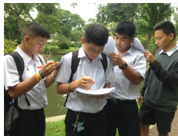
รูปที่ 6. เก็บแบบสอบถาม ณ สวนสราญรมย์