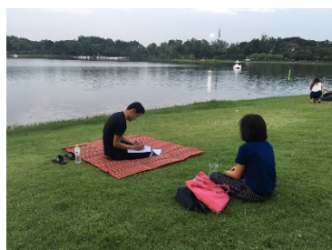
รูปที่ 7. เก็บแบบสอบถาม ณ สวนหลวง ร.9