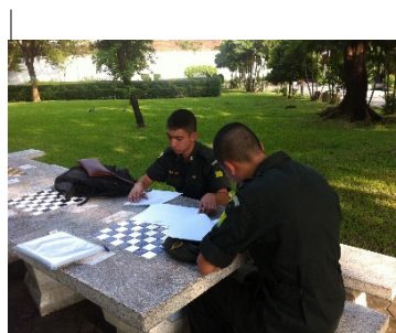
รูปที่ 8. เก็บแบบสอบถาม ณ สวนรมณีนาถ