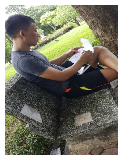
รูปที่ 15. เก็บแบบสอบถาม ณ สวนลุมพินี