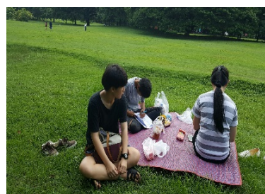
รูปที่ 5. เก็บแบบสอบถาม ณ สวนวชิรเบญจทัศ