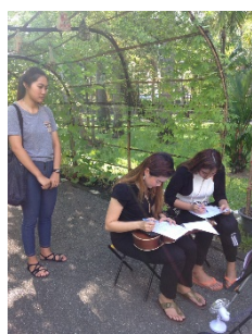
รูปที่ 11. เก็บแบบสอบถาม ณ สวนเสรีไทย