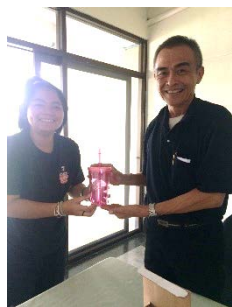
รูปที่ 9. สัมภาษณ์ผู้มีความรู้ด้านการจัดการสวนสาธารณะ