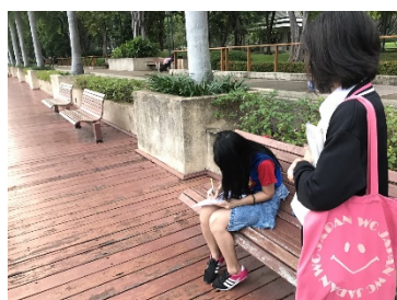
รูปที่ 3. เก็บแบบสอบถาม ณ สวนเบญจกิติ