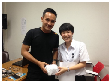
รูปที่ 1. สัมภาษณ์ผู้มีความรู้ทางการท่องเที่ยว เชิงสุขภาพ