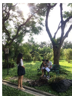
รูปที่ 13. เก็บแบบสอบถาม ณ สวนสมเด็จพระนางเจ้าสิริกิติ์