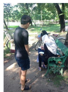
รูปที่ 14. เก็บแบบสอบถาม ณ สวนวชิรเบญจทัศ