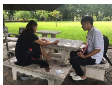
รูปที่ 4. เก็บแบบสอบถาม ณ สวนลุมพินี