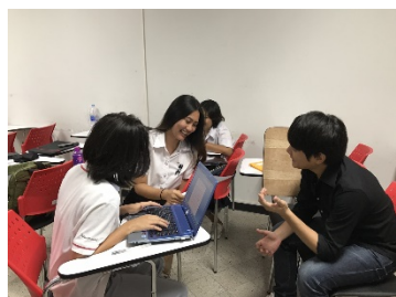
รูปที่ 2. สัมภาษณ์ผู้ใช้งานสวนสาธารณะ