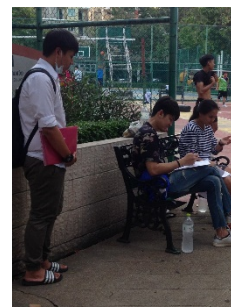
รูปที่ 12. เก็บแบบสอบถาม ณ อุทยานเบญจสิริ