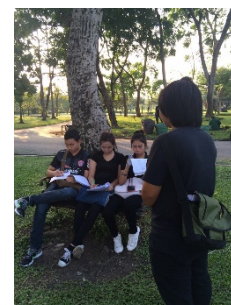
รูปที่ 16. เก็บแบบสอบถาม ณ สวนหลวง ร.9