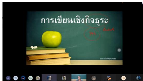
ภาพ 1 การนำเข้าสู่บทเรียน

ผู้สอนทดสอบความรู้ของนักเรียนด้วยการถามตอบเพื่อเป็นการแลกเปลี่ยนความรู้และเป็นการกระตุ้นให้นักเรียนมีความพร้อมในการเรียนพร้อมกับการทบทวนความรู้เดิมก่อนการเริ่มเรียน หลังจากนั้นผู้สอนจะให้ผู้เรียนยกตัวอย่างงานการเขียนเชิงกิจธุระที่มีการใช้งานจริงในชีวิตประจำวันคนละ 1 งาน