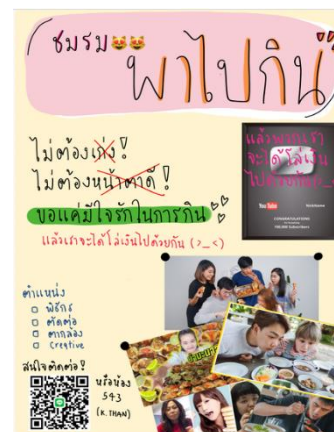
ภาพ 3 สื่อบททวนความรู้ เพื่อวัดและประเมินผล