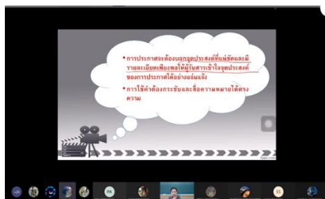
ภาพ 2 สื่อนำเสนอเนื้อหาเพื่อส่งเสริมความรู้ความเข้าใจประกอบการบรรยาย