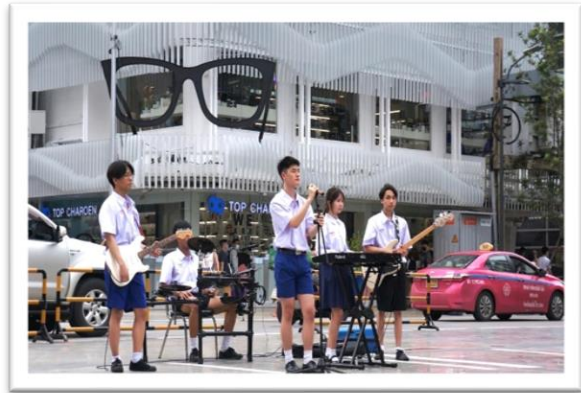
ภาพที่ 10 - 11 : การแสดงดนตรีเปิดหมวก