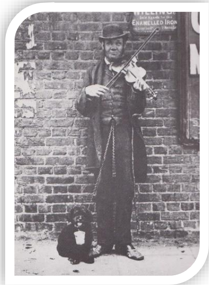
ภาพที่ 4 : buskers

We are buskers แรกเริ่มเดิมที การเล่นดนตรีข้างถนนมีจุดกำเนิดมาจากการแสดงที่เรียกว่า street performance หรือ busking street music จึงไม่ใช่คำที่ใช้เรียกแนวเพลง แต่เป็นคำที่ถูกยกขึ้นมาเรียกการแสดงดนตรีบนท้องถนนมากกว่า โดยในอดีตจะเป็นการโชว์ทักษะอะไรก็ได้ จะซีเรียสหรือขบขันก็ไม่ว่ากันเพื่อสร้างความบันเทิงให้คนที่เดินผ่านไปผ่านมาแลกกับอาหาร เครื่องดื่ม หรือเงิน