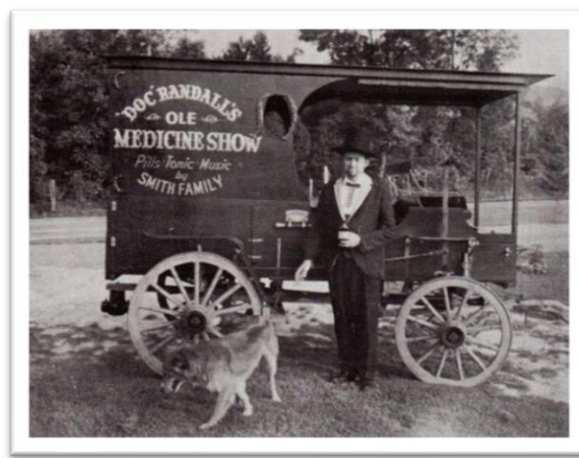
ภาพที่ 5-6 : medicine show

‘medicine show’ รูปแบบของการแสดงก็ตรงตามชื่อของมัน นั่นคือการโฆษณาขายรักษาโรคและสมุนไพรต่าง ๆ ผ่านการแสดงซึ่งเรียกได้ว่าเป็นละครเวทีขนาดย่อม ๆ และเมื่อโชว์ในแต่ละครั้งจบลง ผู้แสดงก็จะวางหมวกลงกับพื้นเพื่อเป็นสัญญาณให้ผู้ชมที่ล้อมวงดูรู้ว่านี่คือเวลาที่พวกเขาสามารถเดินเข้ามาซื้อตัวสินค้าได้แล้ว