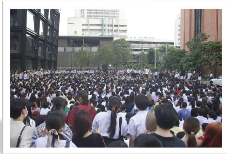
ภาพที่ 1 : กิจกรรมเปิดหมวก

ย่านธุรกิจใจกลางเมืองหลวงสยามสแควร์ (Siam square ) สร้างปรากฏการณ์เพื่อปลุกกระแสความตื่นตัว หลังภาวะโรคระบาด เปิดพื้นที่ให้ทำกิจกรรมทางดนตรีหน้าห้างในการเล่นดนตรีเปิดหมวก ( Walking Street)