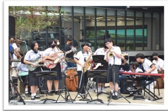
ภาพที่ 8-9 : การแสดงดนตรีเปิดหมวก

ดนตรี คือ ทรัพยากรสำคัญ เป็นทางออกในการกระตุ้นเศรษฐกิจสร้างสรรค์ สร้างรายได้ให้กับประเทศ บ้านเรามีนักดนตรีวัยรุ่นเก่งๆ ที่ขาดการสนับสนุน ภาครัฐพูดถึง Soft Power เป็นกลไกขับเคลื่อนเศรษฐกิจ หน่วยงานรัฐต้องทำงานร่วมกับภาคเอกชน สนับสนุนด้านการเงินบางส่วน ตลอดจนมีสิทธิประโยชน์ทางภาษีจูงใจ การนำดนตรีมาใช้ในมิตินี้ อย่างกรณี วง Yes Indeed กระทรวงพาณิชย์ต้องทำหน้าที่เป็นสะพานเชื่อมพาเยาวชนไปสู่เทศกาลและจับคู่สร้างโอกาสให้เยาวชน ส่งเสริม Soft Power ของไทย ให้เป็นที่รู้จักทั่ว