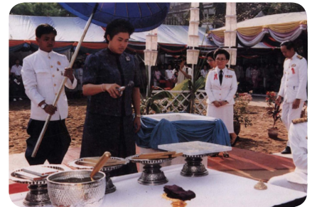
สมเด็จพระเทพรัตนราชสุดาฯ เสด็จพระราชดำเนินมาทรงวางศิลาฤกษ์ “อาคารสมเด็จพระเทพรัตนราชสุดาฯ” เมื่อวันที่ 9 กุมภาพันธ์ 2530

มิถุนายน พ.ศ. 2539 ต่อมาได้รับงบประมาณในการสร้างห้องสมุดหลังใหม่และเปิดให้บริการในเดือนมกราคม พ.ศ. 2541 เป็นต้นมา สำนักหอสมุดกลางใช้ระบบ ห้องสมุดอัตโนมัติและระบบการสืบค้น (SWU Discovery) เพื่อการจัดเก็บและสืบค้นทรัพยากรสารสนเทศร่วมกันภายในเครือข่ายห้องสมุดภายใต้สังกัดมหาวิทยาลัยศรีนครินทรวิโรฒ ได้แก่ ห้องสมุดประสานมิตร ห้องสมุดองครักษ์ ห้องสมุดคณะแพทยศาสตร์องครักษ์ จังหวัดนครนายก ห้องสมุดศูนย์การแพทย์ปัญญานันทภิกขุฯ จังหวัดนนทบุรี และห้องสมุดวิทยาลัยโพธิวิชชาลัย จังหวัดสระแก้ว