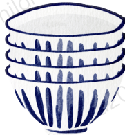
เรืออู่และภาชนะ แพ็ด