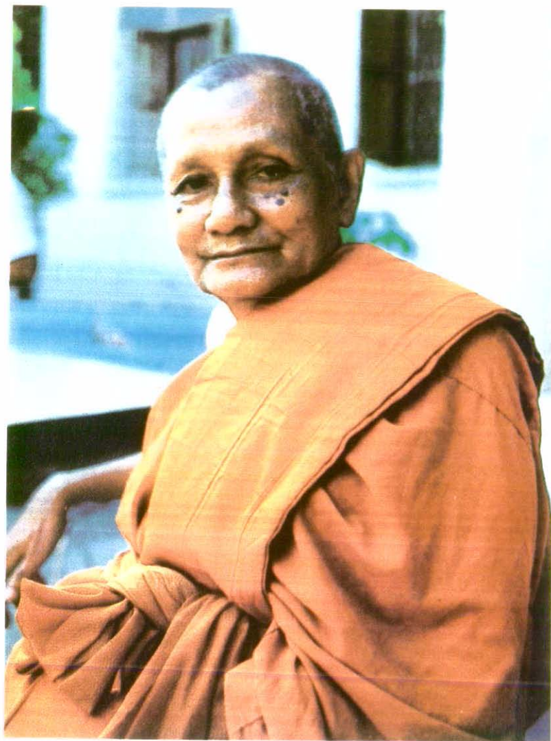
พระธรรมเสนานี