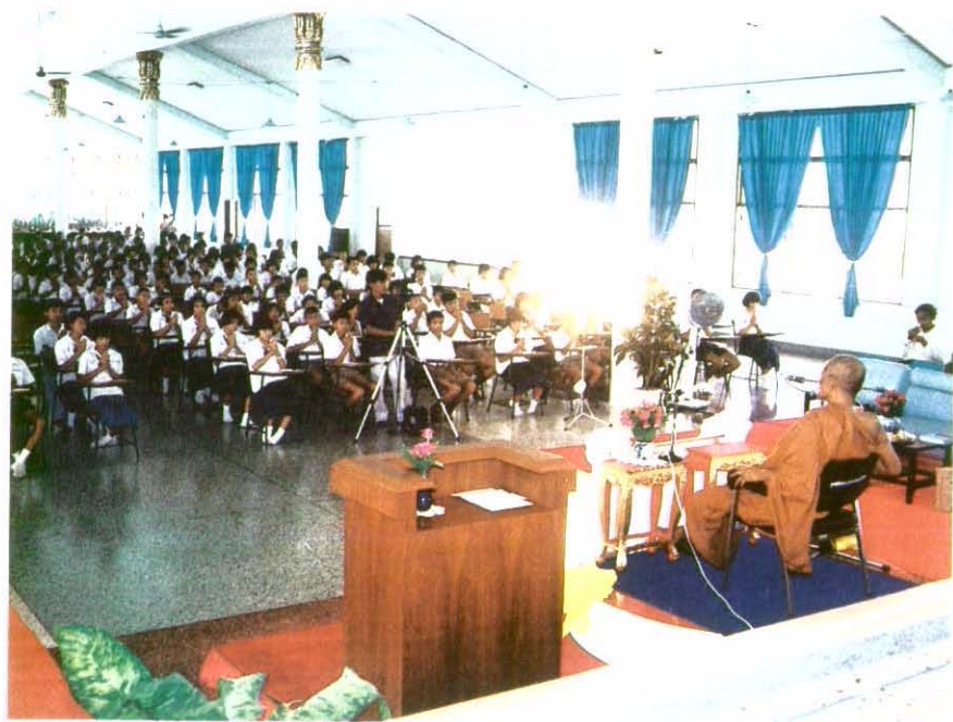
หลวงปู่อบรมสั่งสอนนักเรียนด้วยความเมตตาเสมอ