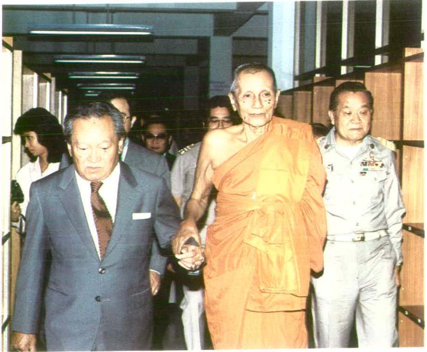
ฯพณฯ พลเอกชาติชาย ชุณหะวัณ นายกรัฐมนตรี เดินทางมาเปิดงานประจำปี ๒๕๓๑ ณ วัดโฆธรรารามวรวิหาร