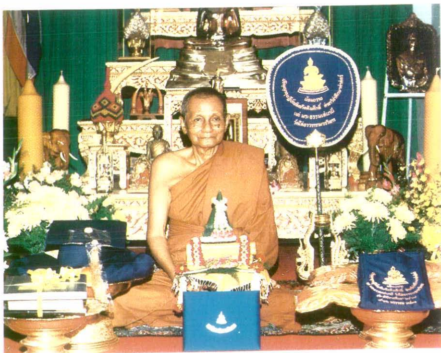
หลวงปู่พระธรรมเสนานีกับปริญญ่าปรัชญาดุฎฐิบัณฑิตกิตติมศักดิ์ สาขา ศึกษาศาสตรื มหาวิทยาลัยรามคำแหง