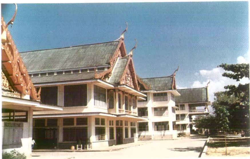
อีกมุมหนึ่งของโรงเรียนพุทธโสธร