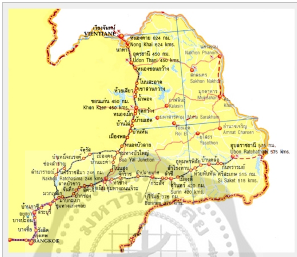
ภาพประกอบ 2 แผนที่เส้นทางรถไฟสายอีสานตั้งแต่ทศวรรษที่ 2500