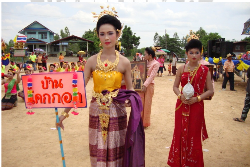
ภาพประกอบ 15 ผู้ถือป้ายชื่อหมู่บ้านของขบวนเชิงบั้งไฟบ้านโคกกอก