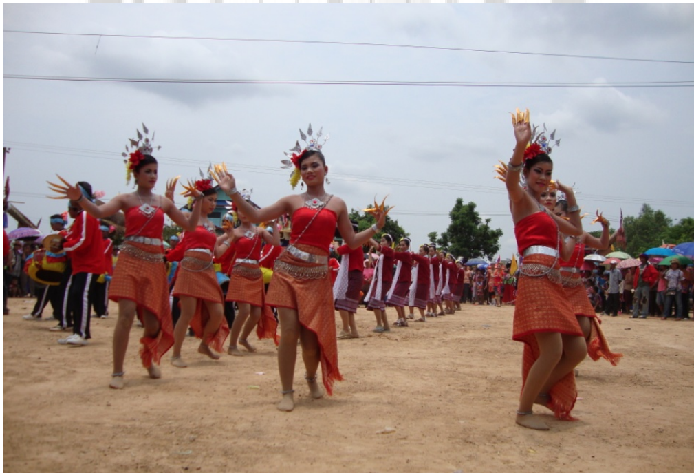
ภาพประกอบ 17 การแสดงศิลปะการรำเซิ้งประกอบเครื่องดนตรีพื้นบ้าน