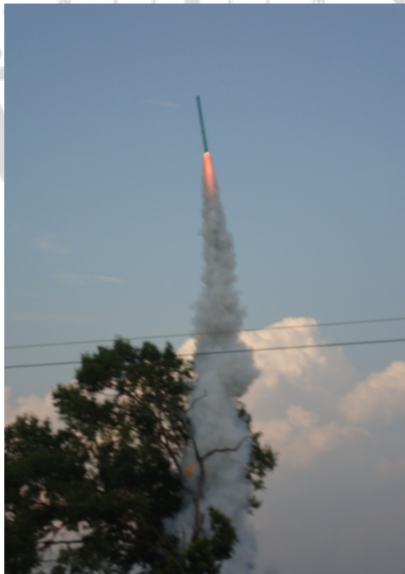
ภาพประกอบ 35 ลักษณะการขึ้นของบั้งไฟ