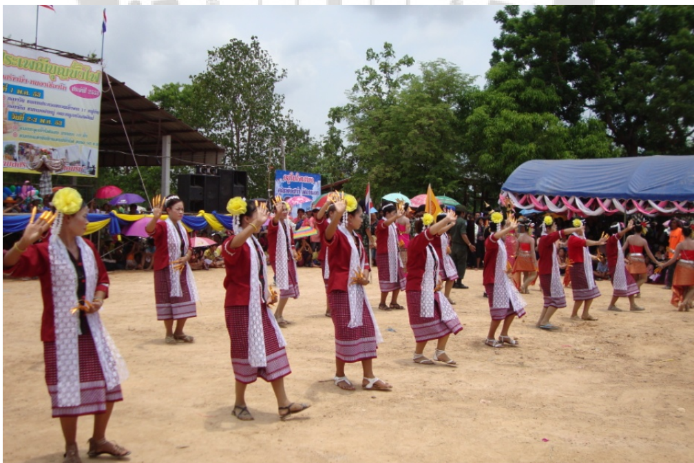
ภาพประกอบ 19 การแสดงศิลปะการรำเซิ้งประกอบเครื่องดนตรีพื้นบ้าน