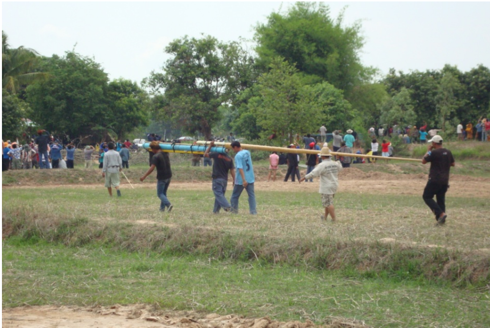
ภาพประกอบ 30 การนำบั้งไฟไปยังฐานจุดบั้งไฟ