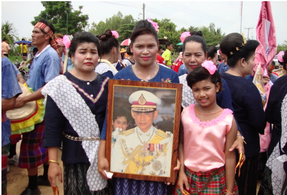
ภาพประกอบ 14 ผู้อันเชิญพระบรมฉายาลักษณ์ของพระบาทสมเด็จพระเจ้าอยู่หัว