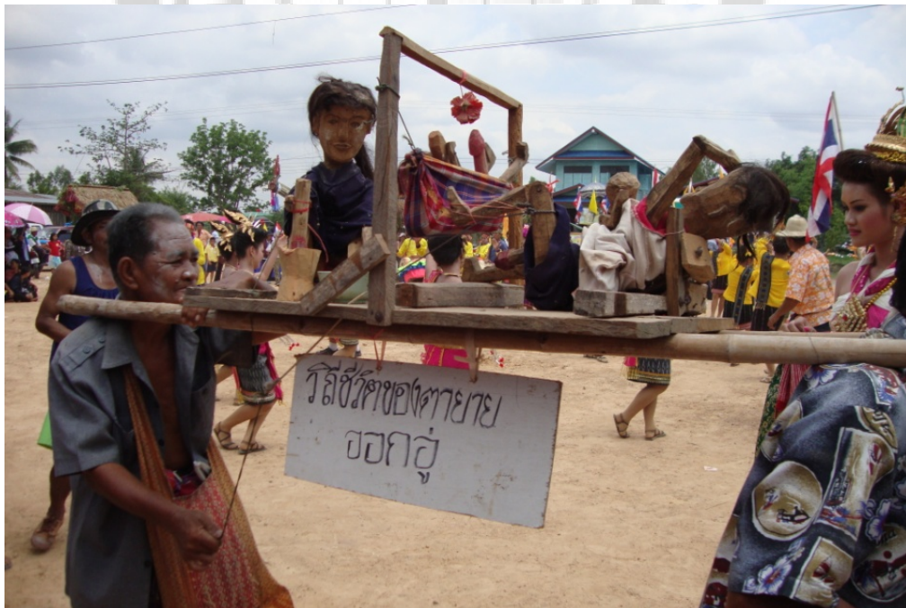
ภาพประกอบ 23 การแสดงวิถีชีวิตความเป็นอยู่ของชาวบ้าน