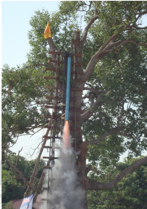
ภาพประกอบ 34 การประทุของบั้งไฟ