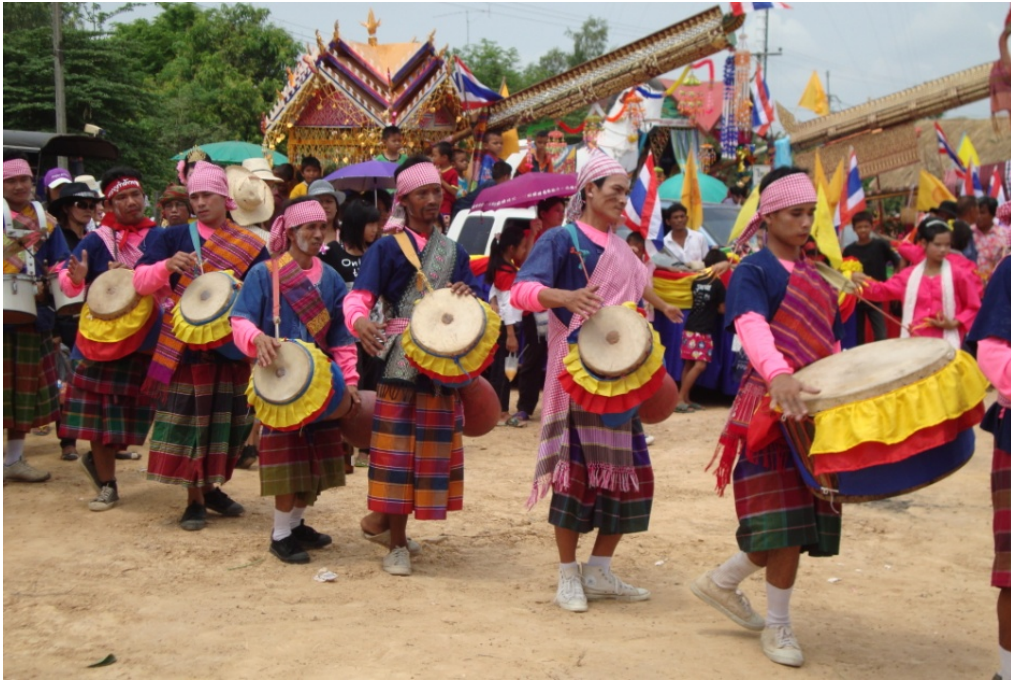
ภาพประกอบ 20 การแสดงดนตรีพื้นบ้านของคณะดาวส่องแสง