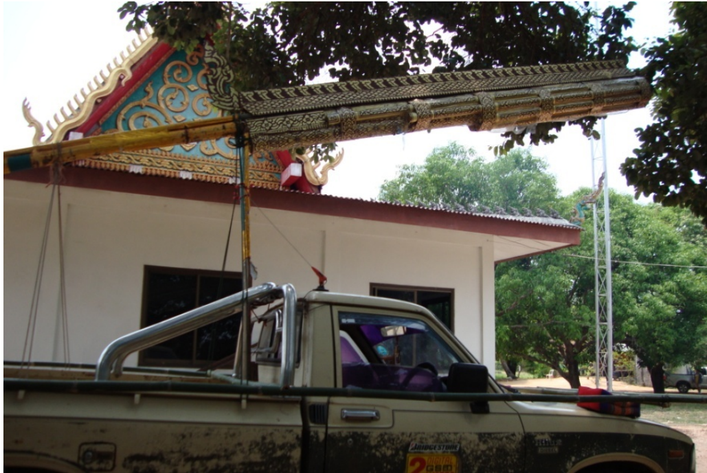
ภาพประกอบ 4 การเตรียมบั้งไฟเอ้ (บั้งไฟที่ไม่ได้ใช้จุดจริง ๆ) เพื่อใช้ตกแต่ง