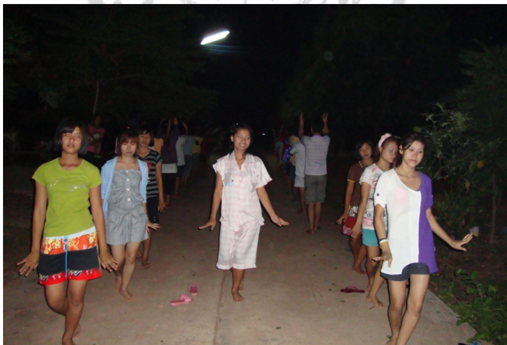
ภาพประกอบ 3 การฝึกซ้อมรำเชิงเพื่อเตรียมความพร้อม