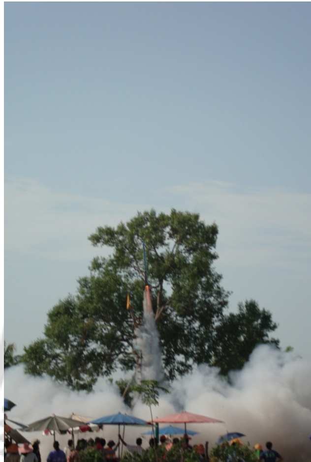
ภาพประกอบ 36 ลักษณะการขึ้นของบั้งไฟ