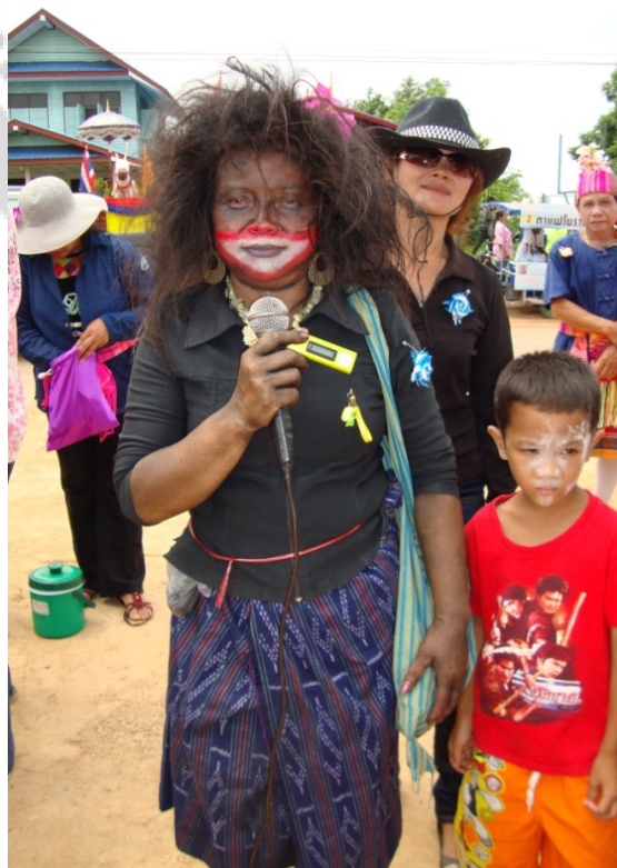
ภาพประกอบ 13 ลักษณะการแต่งกายของผู้ขับร้องกาพย์เซิ้งบั้งไฟ