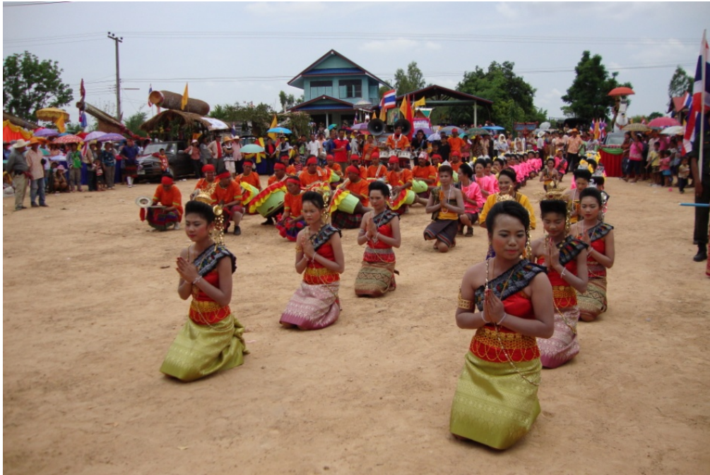
ภาพประกอบ 16 การแสดงศิลปะการรำเซิ้งประกอบเครื่องดนตรีพื้นบ้าน