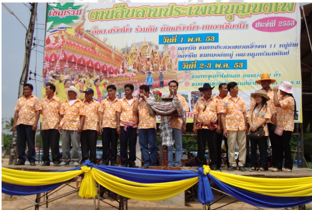
ภาพประกอบ 11 ประธานในพิธีกล่าวเปิดงาน