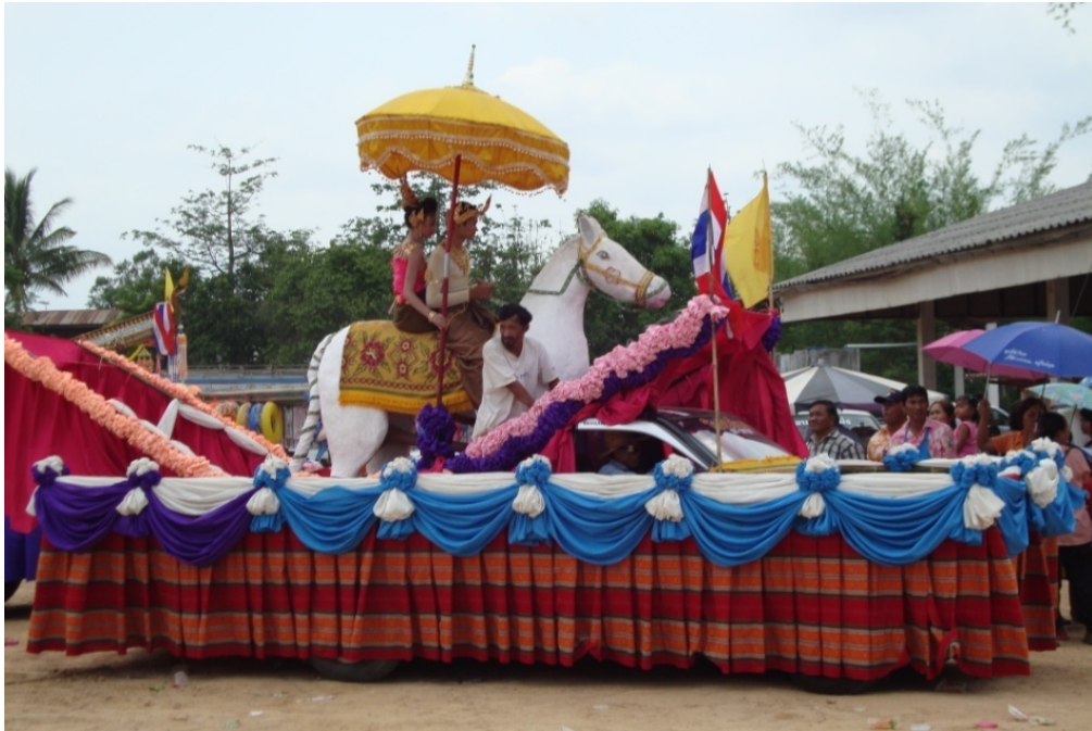
ภาพประกอบ 22 การแสดงความเชื่อเรื่องผาแดงนางไอ่