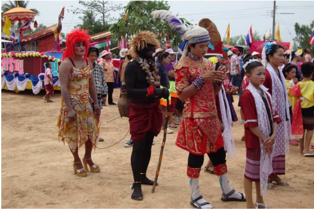
ภาพประกอบ 26 การแสดงตลกของผู้ร่วมขบวนเซ็งบั้งไฟบ้านหินเหล็กไฟ