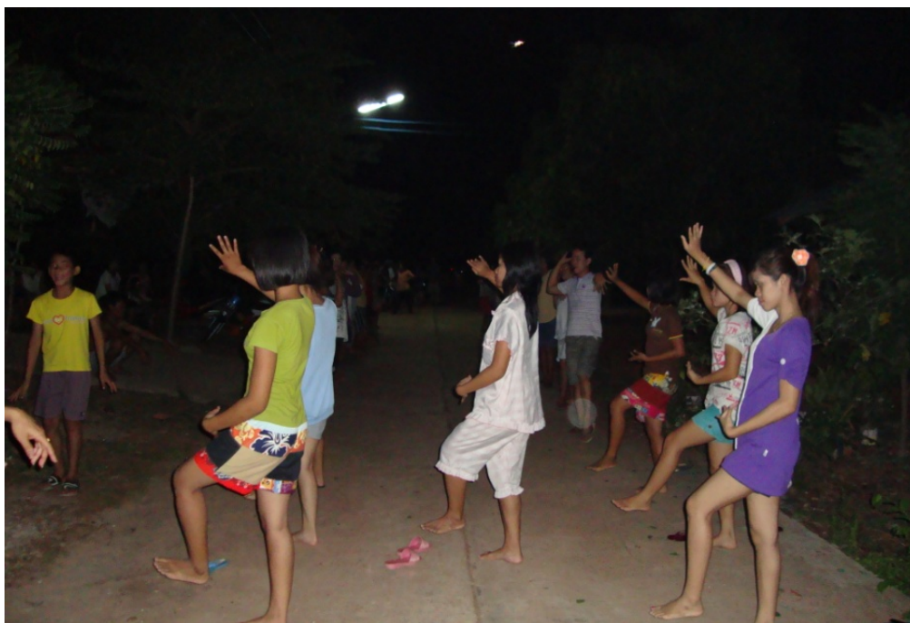
ภาพประกอบ 2 การฝึกซ้อมรำเชิงเพื่อเตรียมความพร้อม