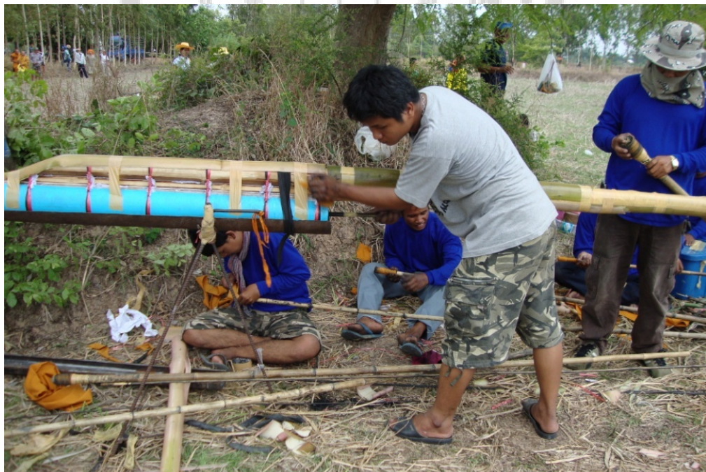
ภาพประกอบ 29 ลักษณะการล้างบั้งไฟของช่างทำบั้งไฟคณะมาตามสั่ง