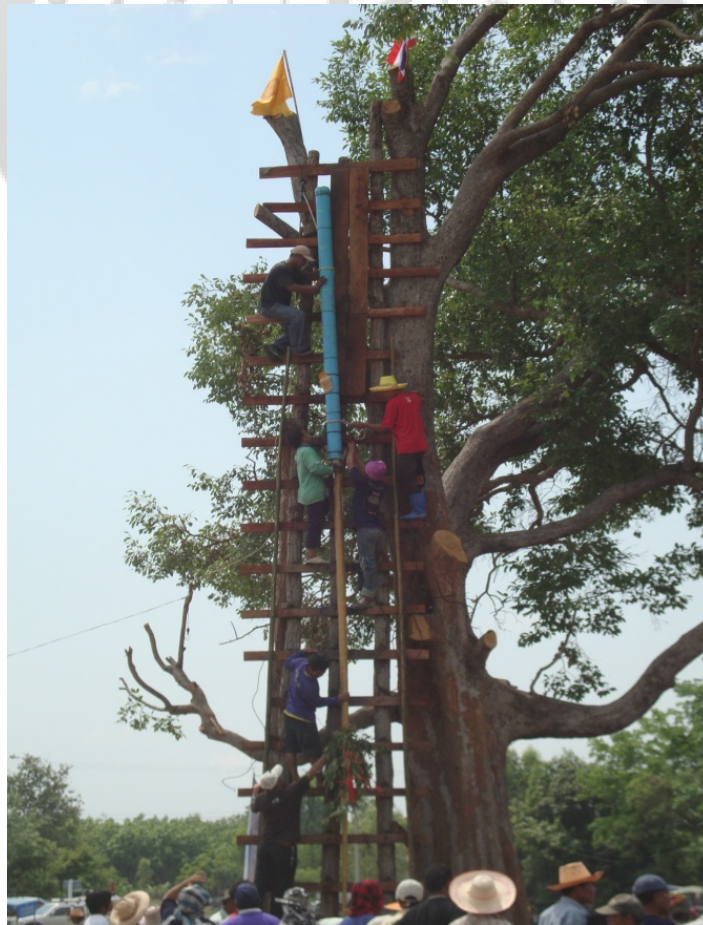
ภาพประกอบ 31 การนำบั้งไฟขึ้นไปยังฐานจุดบั้งไฟ