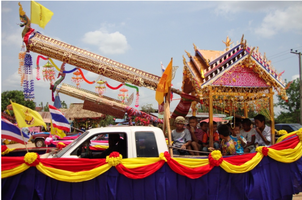
ภาพประกอบ 6 รถบั้งไฟเอ้ที่ตกแต่งอย่างสวยงามแล้ว