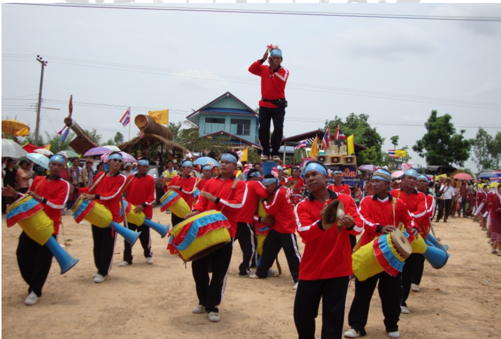
ภาพประกอบ 21 การแสดงดนตรีพื้นบ้านของบ้านหินเหล็กไฟ