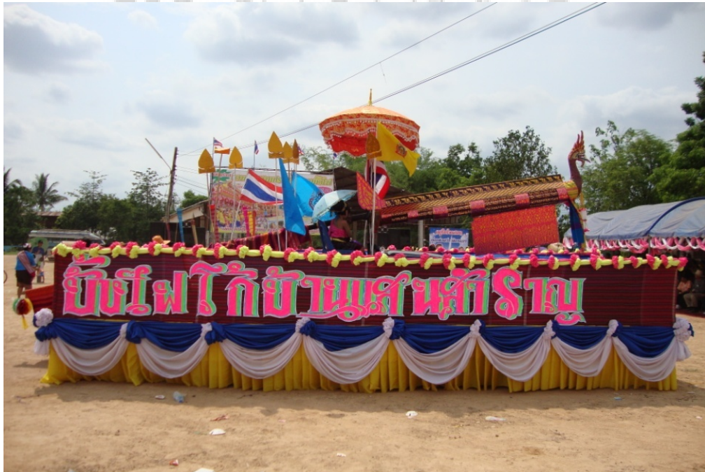
ภาพประกอบ 7 รถบั้งไฟเอ้ที่ตกแต่งอย่างสวยงามแล้ว