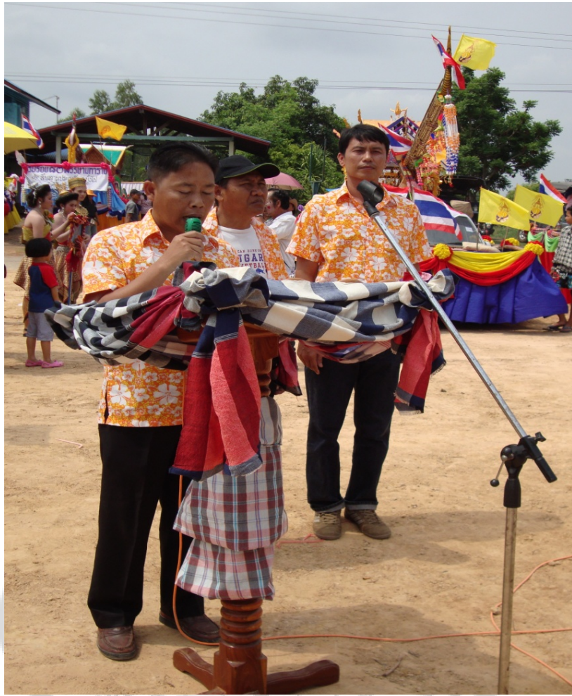
ภาพประกอบ 10 การกล่าวรายงานวัตถุประสงค์ของการจัดงาน