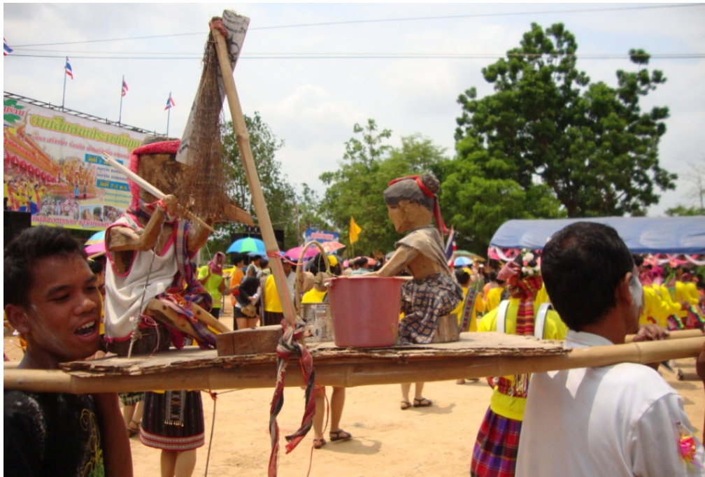
ภาพประกอบ 24 การแสดงวิถีชีวิตความเป็นอยู่ของชาวบ้าน