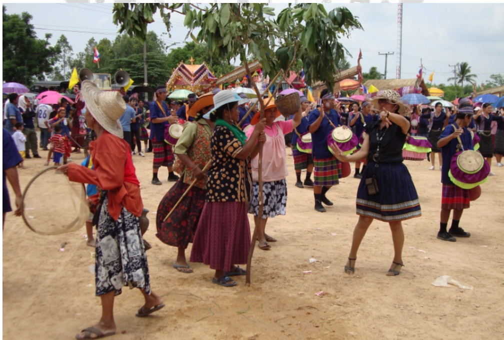
ภาพประกอบ 25 แสดงการหาไข่มดแดงและการใช้สวิง