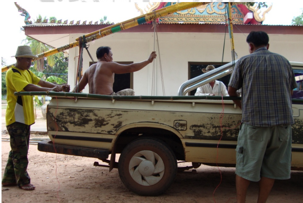
ภาพประกอบ 5 การตกแต่งรถบั้งไฟเอ้เพื่อประกอบขบวนแข่งบั้งไฟ