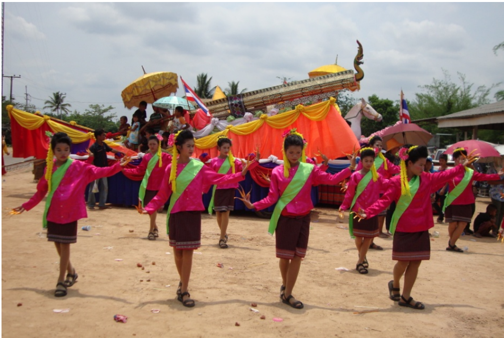
ภาพประกอบ 18 การแสดงศิลปะการรำเซิ้งประกอบเครื่องดนตรีพื้นบ้าน