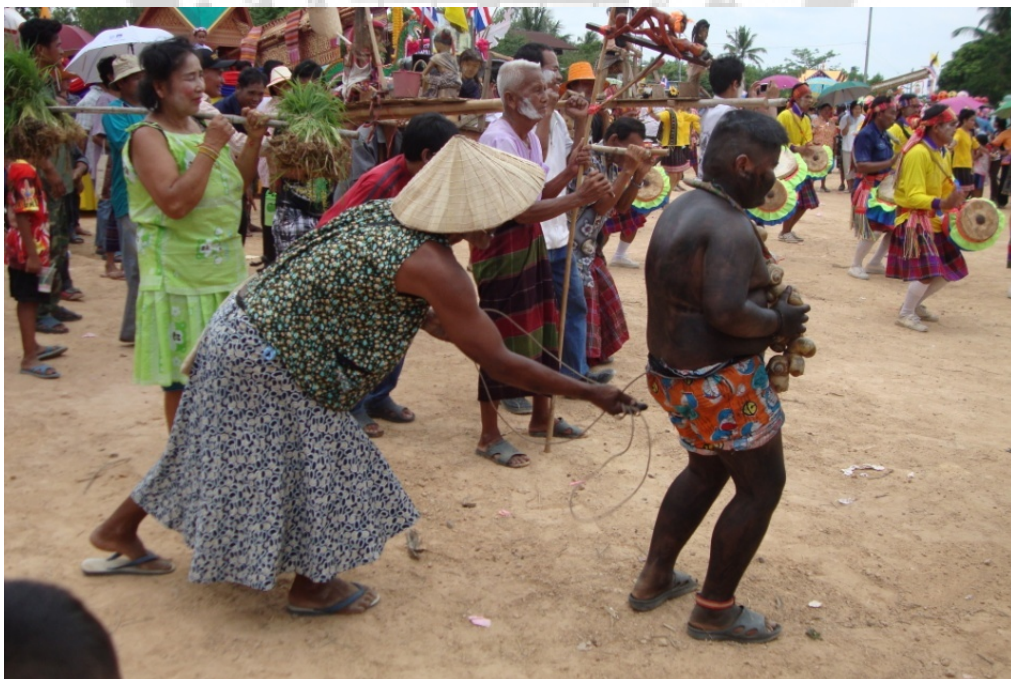
ภาพประกอบ 27 การแสดงตลกของผู้ร่วมขบวนเซ็งบั้งไฟบ้านท่าลาด