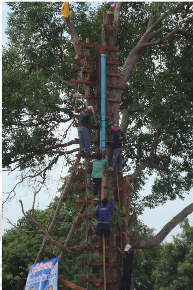
ภาพประกอบ 32 การตรวจสอบความเรียบร้อยของบั้งไฟก่อนจุด