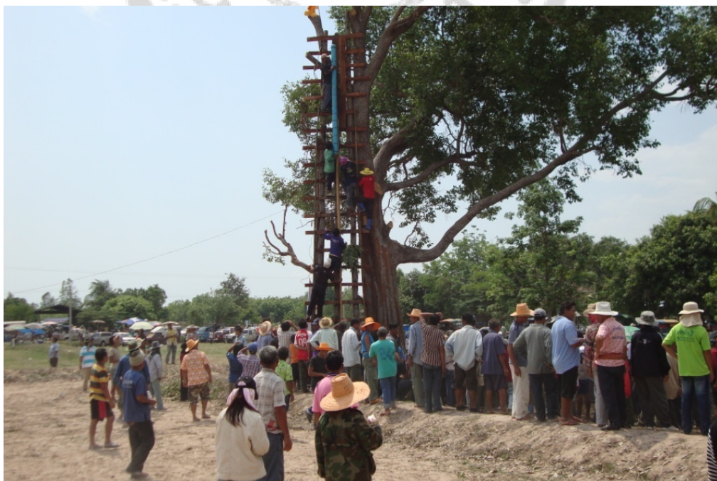
ภาพประกอบ 33 บรรยากาศบริเวณฐานจุดบั้งไฟ