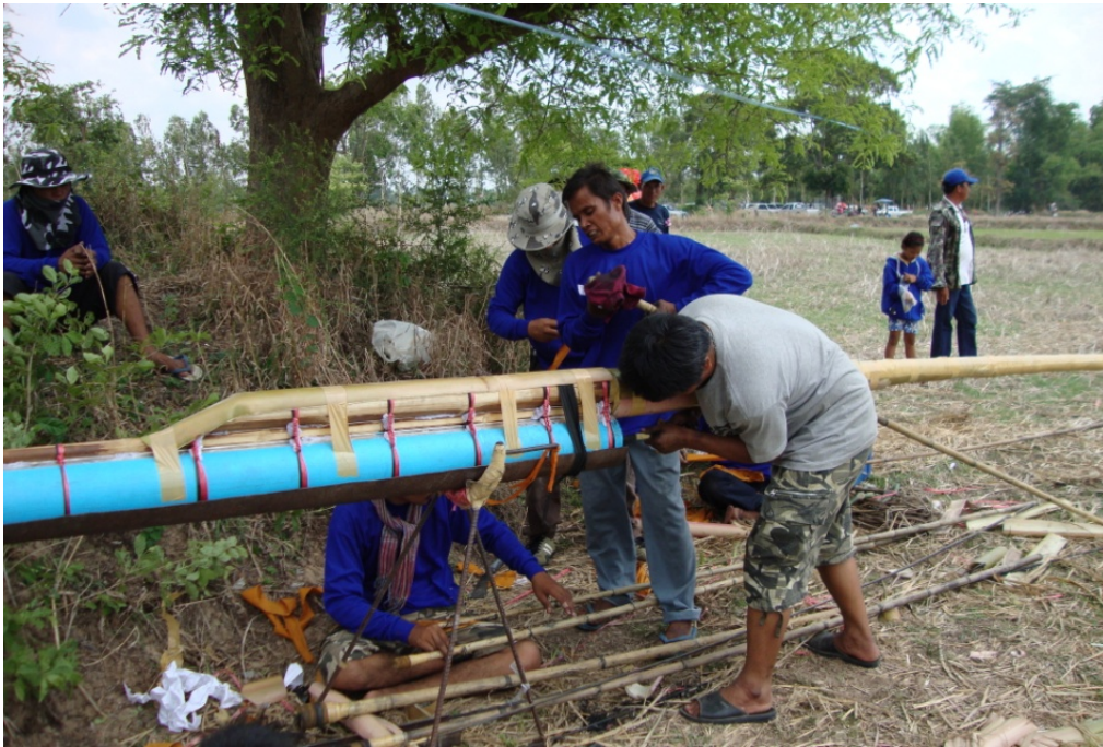
ภาพประกอบ 28 การล้างบั้งไฟ