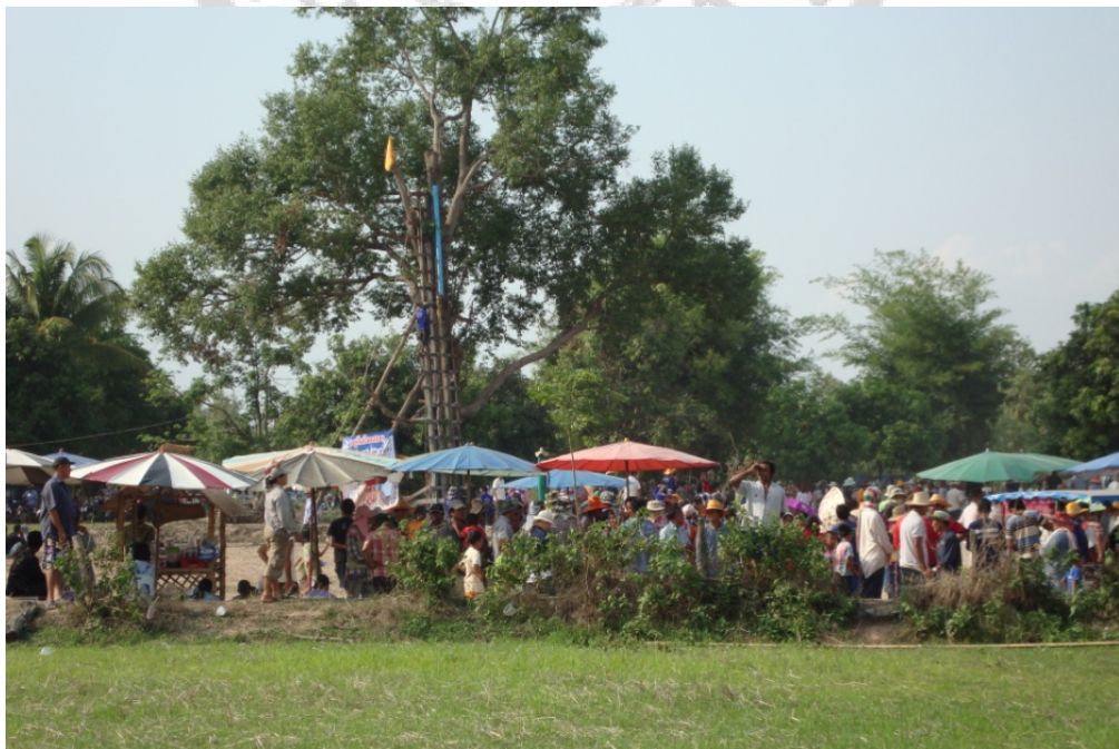
ภาพประกอบ 37 บรรยากาศโดยรอบของฐานจุดบั้งไฟ