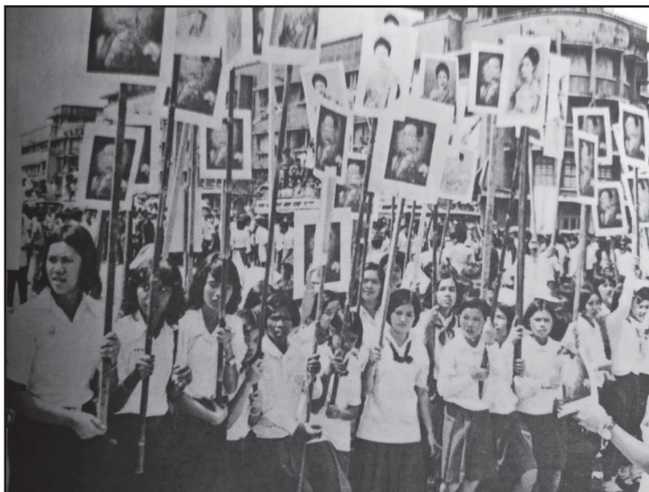
Figure 2: Procession of Students and People during the 14 October 1973 Uprising

การประชุมครั้งใหญ่ของนิสิตนักศึกษาที่มหาวิทยาลัยธรรมศาสตร์ในเดือนตุลาคม ๒๕๑๖ นี้ได้ขยายขึ้นเป็นการเดินขบวนขับไล่รัฐบาลระหว่างวันที่ ๑๓-๑๕ ตุลาคม ๒๕๑๖ ซึ่งเป็นที่รู้จักกันในชื่อ “เหตุการณ์ ๑๔ ตุลาคม ๒๕๑๖” (Chanrochanakit, 2017, p. 115-117; Kraipakorn, 2020, p. 130-151) หากพิจารณาลงไปในรายละเอียดเกี่ยวกับเหตุการณ์ ๑๔ ตุลาคม ๒๕๑๖ พบว่า มีนักเรียนนักศึกษาหญิงที่ร่วมเคลื่อนไหวเรียกร้องรัฐธรรมนูญและสิทธิเสรีภาพตามระบอบประชาธิปไตย โดยนักศึกษาหญิงจำนวนหนึ่งได้มีส่วนร่วมในการประชุมกับองค์การนักศึกษามหาวิทยาลัยธรรมศาสตร์เกี่ยวกับการชุมนุมเรียกร้องรัฐธรรมนูญ และในการเคลื่อนขบวนออกจากมหาวิทยาลัยธรรมศาสตร์ไปตามถนนราชดำเนินไปยังลานพระบรมรูปทรงม้า เยาวชนนักเรียนนักศึกษาหญิงจำนวนมากอาสาเป็นแถวหน้าถือธงชาติและพระบรมฉายาลักษณ์ของพระบาทสมเด็จพระบรมชนกาธิเบศร มหาภูมิพลอดุลยเดชมหาราชและสมเด็จพระนางเจ้าสิริกิติ์พระบรมราชินีนาถ พระบรมราชชนนีพันปีหลวง เดินอยู่หน้าขบวนด้วยความมุ่งหวังให้เป็นการปลุกเร้าให้ประชาชนเห็นว่าแม่ผู้หญิงตัวเล็ก ๆ ก็ไม่หวั่นไหวในการต่อสู้ (Chaiyarose, 2004, p. 113-116)