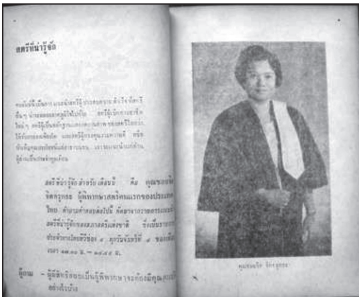
Figure 3: Chalorjit Jittarutta, First Female Judge in Thailand

แห่งวงการตุลาการของประเทศไทยคือ คุณชลอจิต จิตตระกูลธะ ซึ่งสอบแข่งขันเพื่อดำรงตำแหน่งผู้พิพากษาศาลคดีเด็กและเยาวชน (Udomchanya, 1998, p.17) เพื่อความกระจ่างเกี่ยวกับการเข้าสู่ตำแหน่งผู้พิพากษาของคุณชลอจิต จิตตระกูลธะ ผู้พิพากษาศาลตรีคนแรกของประเทศไทยจึงขออธิบายถึงข้อกำหนดของพระราชบัญญัติระเบียบข้าราชการตุลาการ พ.ศ. ๒๔๙๗ ซึ่งมีผลบังคับใช้อยู่ตั้งแต่ พ.ศ. ๒๔๙๗-๒๕๒๐ ครอบคลุมเวลาที่คุณชลอจิตขึ้นมาดำรงตำแหน่งผู้พิพากษา พระราชบัญญัติฉบับนี้ได้กำหนดคุณสมบัติของผู้ดำรงตำแหน่งผู้พิพากษาไว้ ๒ ประการดังที่ได้กล่าวไว้ข้างต้นแล้วคือ ๑) ผู้สมัครสอบข้าราชการตุลาการต้องสอบไล่ได้วิชากฎหมายจากสำนักอบรมศึกษากฎหมายแห่งเนติบัณฑิตยสภา ๒) ผู้สมัครสอบต้องเป็นผู้ที่คณะกรรมการแพทย์มีจำนวนไม่น้อยกว่า ๓ คน ซึ่งคณะกรรมการตุลาการศาลยุติธรรม (ก.ต.) กำหนดข้อได้ตรวจร่างกายและจิตใจแล้ว และ ก.ต. พิจารณารายงานของแพทย์แล้วเห็นว่าสมควรรับสมัครได้