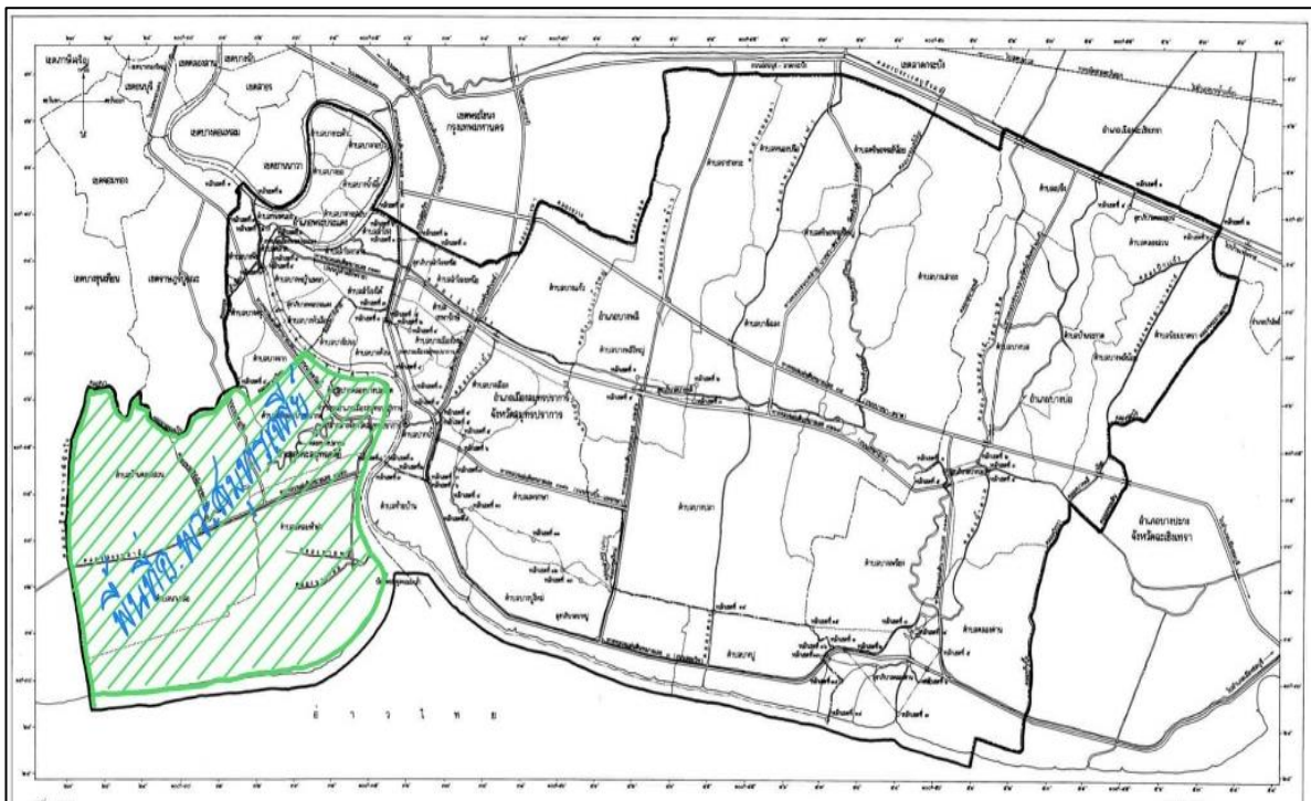
ภาพที่ 2 แสดงพื้นที่อำเภอพระสมุทรเจดีย์ จังหวัดสมุทรปราการ