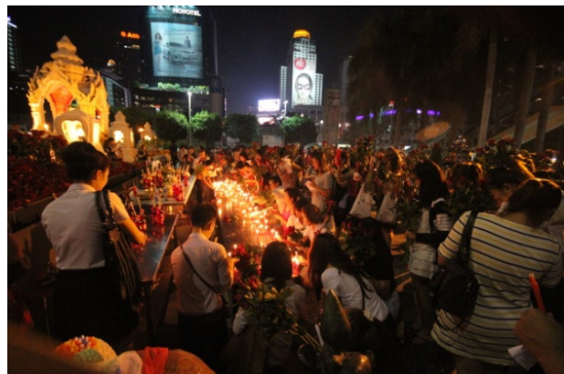
ภาพที่ 7 บรรยากาศ ผู้คนจะยิ่งมากขึ้นและสักการะเมื่อถึงเวลา 21.30 น.

พระอินทร์ หรือท้าวอมรินทร์ราชาเจ้า ตั้งอยู่หน้าห้างอมรินทร์พลาซ่า พระอินทร์เป็นประมุขแห่งเทวดา มีหน้าที่ปกป้องสวรรค์ และโลก ผู้คนเชื่อว่า พระอินทร์เป็นเทพแห่งสงคราม ส่วนเทพเจ้าอีก 3 องค์แม้จะไม่ได้อยู่ในที่ตั้งที่โดดเด่นเท่า 4 องค์แรกคือ พระวิษณุหรือพระนารายณ์ เพราะพระนารายณ์ทรงสุบรรณ ตั้งอยู่ด้านหน้าโรงแรมอินเตอร์คอนติเนนตัล มีหน้าที่พิทักษ์ 3 โลก และถือเป็นเทวดาแห่งการปราบมาร และการคุ้มครองดูแลโลก พระลักษมี อยู่ในห้างเกษรพลาซ่า แต่เปิดให้คนทั่วไปเข้าไปสักการะ แต่ที่ประดิษฐานอาจส่งผลต่อจำนวนผู้คนเล็กน้อยเพราะอยู่ชั้น 4 คุณลักษณะของพระลักษมีเป็นเทพแห่งความร่ำรวย โชคชะตา ความรัก ความงาม ความอุดมสมบูรณ์