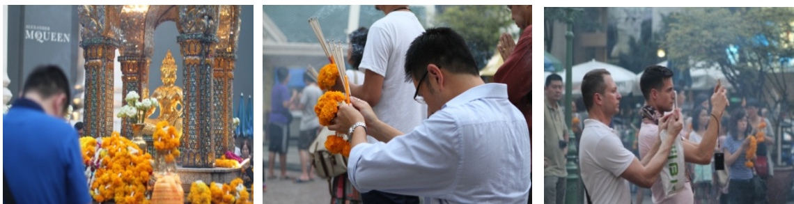
ภาพที่ 2-4 การสักการะพระพรหมบริเวณสี่แยกราชประสงค์

ท้าวมหาพรหม นับว่าเป็นจุดที่ก่อให้เกิดสี่แยกเทพเจ้าขึ้นมา เพราะกำเนิดมาตั้งแต่ ปี 2499 ที่โรงแรมเอราวัณจะเปิดกิจการ และเกิดการทักท้วงจนต้องมีการตั้งศาลมหาพรหมขึ้นล้างอาถรรพ์และอัญเชิญมาประดิษฐาน จากนั้นกิจการของโรงแรมเอราวัณก็เจริญสืบมา รวมทั้งมีคนมาสักการะเพิ่มขึ้นเมื่อสัมฤทธิ์ผลทำให้แพร่กระจายรวดเร็วขึ้น ทั้งนักท่องเที่ยวชาวไทยและต่างประเทศ ด้วยเชื่อว่าพระพรหมจะปัดเป่าโชคร้ายและเสริมสิริมงคลให้กับสถานที่นั้นๆ ตามตำนานการเกิดพระพรหมว่าพระพรหมคือเทพเจ้าผู้สร้างโลก (the creator) และเป็นจุดกำเนิดสำคัญของลัทธิบูชาเทพเจ้าในเมืองไทย(นิพัทธ์พร เพ็งแก้ว,110) ผู้มาไหว้พระพรหมส่วนใหญ่เป็นนักท่องเที่ยวจีนในเวลากลางวันเพราะเป็นไฮไลท์ในโปรแกรมท่องเที่ยวที่ขาดไม่ได้ ส่วนนักท่องเที่ยวอื่น ๆ มาประปรายเพื่อทำความเคารพ แต่ไม่มากถึงกับบูชาให้มีนางรำรำถวาย การรำถวายจะมีราคาที่แตกต่างกันตามขนาดที่เรียกว่า “ชุดใหญ่” “ชุดเล็ก” ขึ้นกับของไหว้และระยะเวลาในการรำ โดยจะมีเจ้าหน้าที่ของมูลนิธิช่วยดำเนินการจัดคิวให้ แต่ที่เฝ้าสังเกตก็ดูเหนื่อยเช่นกันเพราะจำนวนคนไหว้มีมาก นางรำมีน้อยบางครั้งรำได้เพียง1-2 นาทีก็หมดรอบ ส่วนดอกไม้ ช้างหรือสิ่งสักการะอื่นหาซื้อได้ด้วยราคาที่เท่ากันด้านหน้าศาล แต่ถ้าต้องการเพิ่มเติมมากกว่าชุดมาตรฐานผู้ไหว้คงต้องตัดสินใจและต่อรองราคากับคนขายด้วยกลยุทธ์การขายที่นำเรื่องบุญและความสำเร็จที่จะได้ของพระพรหมมาสื่อความหมาย