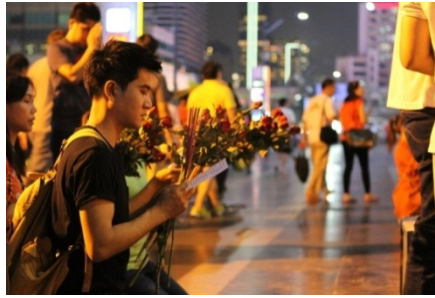
ภาพที่ 5-6 ผู้มาสักการะพระตรีมูรติ ด้วยชุดของไหว้สีแดง คือดอกไม้ ธูปและเทียน

พระอินทร์ หรือท้าวอมรินทร์ราชาเจ้า ตั้งอยู่หน้าห้างอมรินทร์พลาซ่า พระอินทร์เป็นประมุขแห่งเทวดา มีหน้าที่ปกป้องสวรรค์ และโลก ผู้คนเชื่อว่า พระอินทร์เป็นเทพแห่งสงคราม ส่วนเทพเจ้าอีก 3 องค์แม้จะไม่ได้อยู่ในที่ตั้งที่โดดเด่นเท่า 4 องค์แรกคือ พระวิษณุหรือพระนารายณ์ เพราะพระนารายณ์ทรงสุบรรณ ตั้งอยู่ด้านหน้าโรงแรมอินเตอร์คอนติเนนตัล มีหน้าที่พิทักษ์ 3 โลก และถือเป็นเทวดาแห่งการปราบมาร และการคุ้มครองดูแลโลก พระลักษมี อยู่ในห้างเกษรพลาซ่า แต่เปิดให้คนทั่วไปเข้าไปสักการะ แต่ที่ประดิษฐานอาจส่งผลต่อจำนวนผู้คนเล็กน้อยเพราะอยู่ชั้น 4 คุณลักษณะของพระลักษมีเป็นเทพแห่งความร่ำรวย โชคชะตา ความรัก ความงาม ความอุดมสมบูรณ์