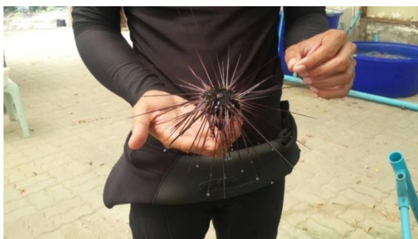
ภาพประกอบที่ 8 เม่นทะเล ( Diademasetosum ) เกาะแสมสารอำเภอสัตหีบจังหวัดชลบุรี

เอคไคโนเดิร์ม หมายถึง สัตว์ที่ผิวหนังเป็นหนาม หรือมีแผ่นหินปูนอยู่ใต้ผิวหนัง จัดอยู่ใน Phylum Echinodermata แบ่งออกเป็น 5 กลุ่ม คือ ดาวขนนก (Class Crinoidea) ดาวทะเล (Class Asteroidea) และดาวเปราะ (Class Ophiuroidea) เม่นทะเล ( Diademasetosum ) และหริญทะเล (Class Echinoidea) และปลิงทะเล (Class Holothuroidea) เอคไคโนเดิร์มเป็นสัตว์ทะเลที่มีประโยชน์ทางเศรษฐกิจ และมีบทบาทสำคัญในระบบนิเวศทางทะเลโดยพวกดาวทะเลใช้เป็นสารเพิ่มคุณค่าในอาหารสัตว์เป็นปุ๋ยจำพวกไนโตรเจน พวกปลิงทะเลและไขของเม่นทะเลใช้เป็นอาหารและมีราคาแพง (สุเมตต์ บุจฉากร และคณะ, ม.ป.ป.)