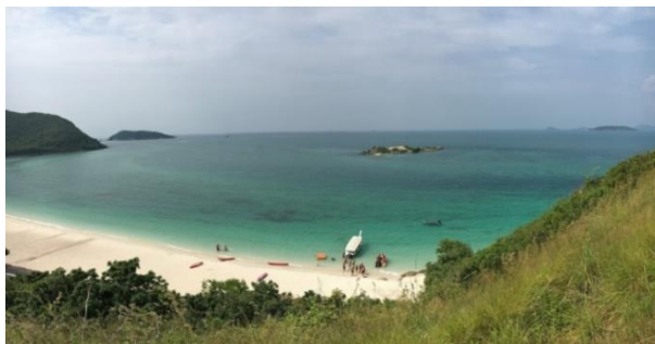
ภาพประกอบที่ 3 จุดชมวิวหาดลูกกลม เกาะเสมสาร อำเภอสัตหีบ จังหวัดชลบุรี

หมู่เกาะเสมสารประกอบด้วย เกาะเสมสาร เกาะขาม เกาะแรด เกาะปลาหมึก เกาะจวง เกาะจาน เกาะโรงโชน เกาะโรงหนัง และเกาะฉางเกลือ ซึ่งเกาะเสมสารเป็นเกาะที่มีขนาดใหญ่ที่สุดใน 9 เกาะ อยู่ห่างจากฝั่ง 1.8 กิโลเมตร กว้าง 1.1 กิโลเมตร ยาว 2.8 กิโลเมตร มีเนื้อที่ 2,737 ไร่ 3 งาน 36 ตารางวา รูปทรงยาวรี