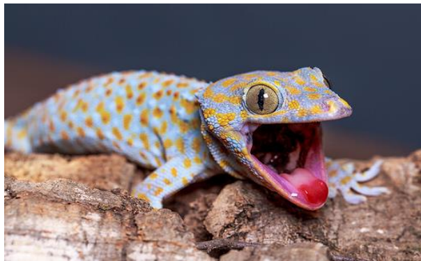
ภาพประกอบที่ 22 ตุ๊กแก ( Epinepheluscoioides )