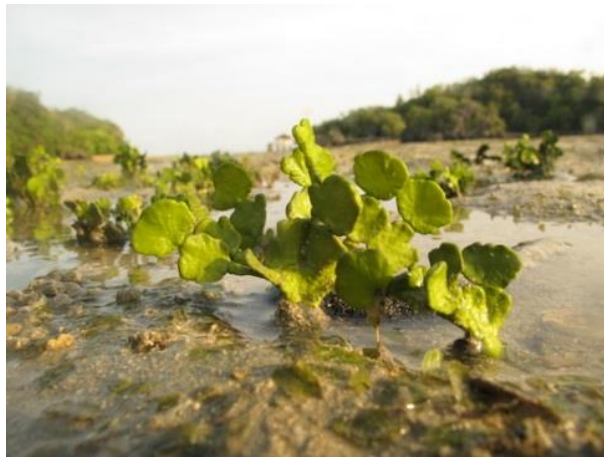
ภาพประกอบที่ 11 สาหร่ายใบมะกรูด ( Halimeda )