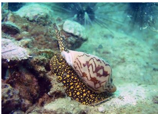
ภาพประกอบที่ 16 หอยจุกพราหมณ์ ( Cymbiolanobilis )