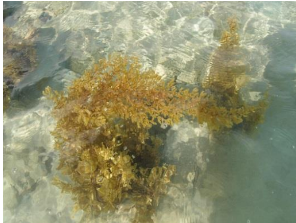
ภาพประกอบที่ 10 สาหร่ายฟูน ( Sargassum )