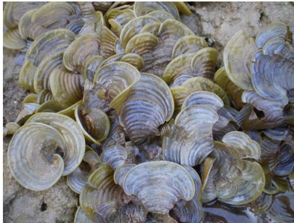
ภาพประกอบที่ 9 สาหร่ายเห็ดหูหนู ( Padinagymnospora )

สาหร่ายทะเลเป็นผู้ผลิตขั้นต้น เป็นแหล่งอาหาร แหล่งอาศัยหลบภัย วางไข่ และอนุบาลสัตว์น้ำวัยอ่อนของสัตว์ทะเลนานาชนิด นอกจากนี้สาหร่ายทะเลยังเป็นอาหารของมนุษย์ และใช้ในอุตสาหกรรมอาหารและยา สาหร่ายทะเลที่พบเห็นได้บ่อยในบริเวณเกาะแสมสาร ได้แก่ สาหร่ายเห็ดหูหนู ( Padinagymnospora ) สาหร่ายใบมะกรูด ( Halimedamacrolobadecaima ) สาหร่ายจอก ( Pista stratiotes ) (จากการประชุมวิชาการทรัพยากรไทย, 2546)