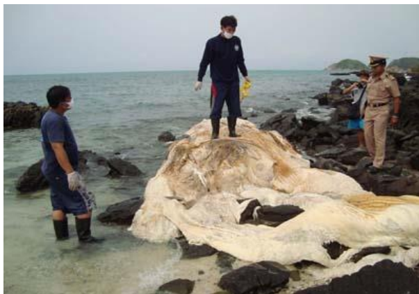
ภาพประกอบที่ 18 ซากวาฬบรูด้าที่เกยตื้นบริเวณหาดเตย

ภายหลังการชันสูตร ได้นำซากวาฬดังกล่าวไปฝังยังบริเวณใกล้เคียง เพื่อให้เศษเนื้อและไขมัน ย่อยสลาย ก่อนจะเก็บรวบรวมชิ้นส่วนกระดูกมาจัดแสดง ณ โรงเรียนชั่วคราว บนเกาะแสมสาร (พิพิธภัณฑสถานธรรมชาติวิทยา องค์การพิพิธภัณฑทวิทยาาสตร์แห่งชาติ, ม.ป.ป.)