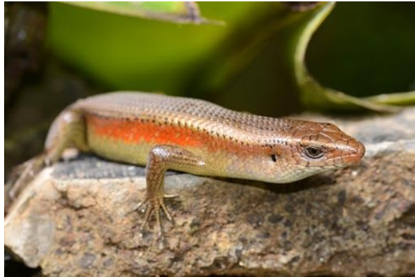
ภาพประกอบที่ 21 จิ้งเหลน ( Scincidae )