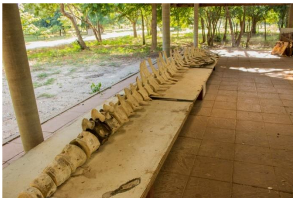
ภาพประกอบที่ 19 ชิ้นส่วนกระดูกวาฬบรูด้า เกาะแสมสาร