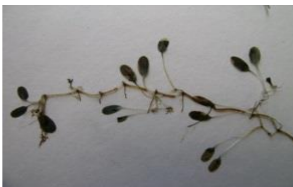
ภาพประกอบที่ 13 หญ้าใบมะกรูดแคระ ( Halophila minor )