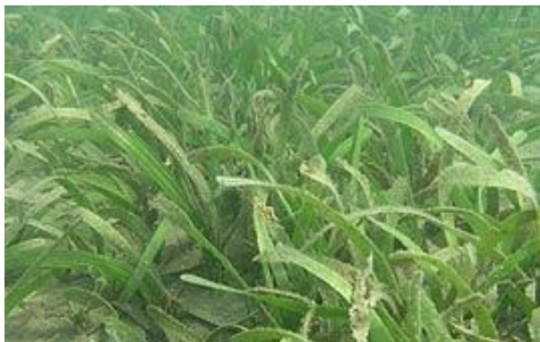
ภาพประกอบที่ 15 หญ้าชะเงาใบฟันเลื่อย ( Cymodocea serrulata )