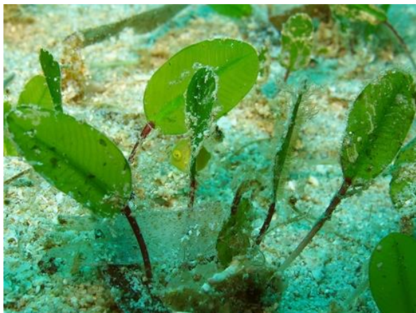
ภาพประกอบที่ 14 หญ้าใบมะกรูด ( Halophila ovalis )