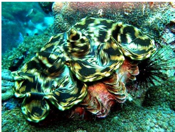
ภาพประกอบที่ 17 หอยมือเสือ ( Tridacnasquamosa )