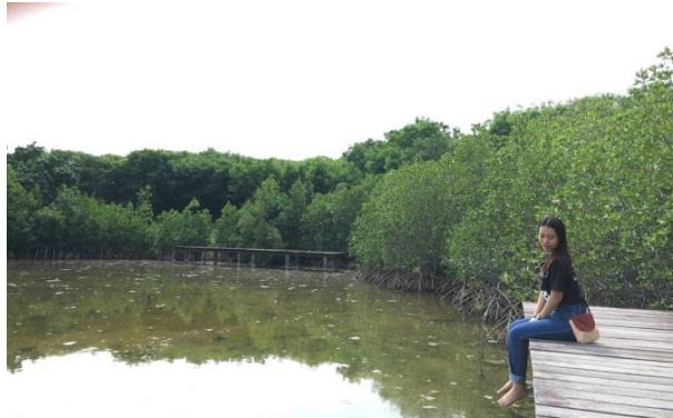
ภาพประกอบที่ 5 ป่าชายเลน เกาะแสมสาร อำเภอสัตหีบ จังหวัดชลบุรี

พื้นที่ศึกษาทดลองปลูกพรรณไม้ป่าชายเลน จากการขุดทรายเพื่อนำไปใช้ในการก่อสร้าง ทำให้เกิดเป็นหลุมบ่อขนาดใหญ่ประมาณ 1 ไร่ จึงเกิดแนวคิดที่จะใช้พื้นที่ดังกล่าวให้เกิดประโยชน์สูงสุดโดยการทดลองปลูกพรรณไม้ป่าชายเลนขึ้น ซึ่งมีวัตถุประสงค์เพื่อร่วมสนองพระราชดำริในการปลูกรักษาพันธุกรรมพืช ใช้เป็นแหล่งศึกษาเรียนรู้ระบบนิเวศป่าชายเลน ให้เกิดความเข้าใจและเห็นความสำคัญของระบบนิเวศป่าชายเลน