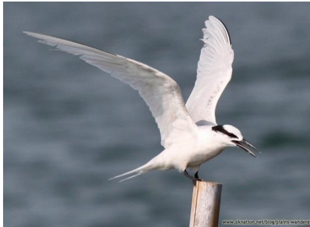
ภาพประกอบที่ 23 นกนางนวลเกลบท้ายทอยดำ ( Sterna sumatrana )

( Egeatta sacra ) นกตบยุงเล็ก ( Caprimulgus asiaticus ) และนกกระเต็นอกขาว ( Halcyon smymensis ) เป็นต้น (หนังสือนกในหมู่เกาะแสมสาร, 2553)