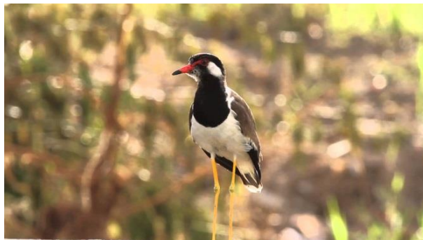
ภาพประกอบที่ 24 นกกระเตแต้แว๊ด ( Vanellus indicus )