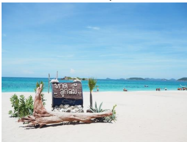
ภาพประกอบที่ 2 หาดลูกกลม เกาะเสมสาร อำเภอสัตหีบ จังหวัดชลบุรี

เกาะเสมสาร มียอดเขาที่สูงที่สุด 167 เมตร อยู่ทางทิศเหนือของเกาะ ขนาดย่อม 1 ลูก สูง 156 เมตร อยู่ทางทิศใต้ของเกาะและเนินเล็กเนินน้อยอีกบางส่วน ลักษณะเป็นดินลูกรังปนหินลูกรัง มีแหล่งน้ำจืดตามธรรมชาติเพียงเล็กน้อย มีชายหาดจำนวน 5 หาด คือ หาดเทียน อยู่ทางทิศ ตะวันออก หาดแหลมฝรั่ง อยู่ทางทิศตะวันออกเฉียงใต้ หาดเตย และหาดกรวด อยู่ทางทิศตะวันตก และหาดลูกกลม อยู่ทางทิศเหนือ มี 3 แหลม คือ แหลมลูกกลม แหลมต้นเลียบ และแหลมฝรั่ง