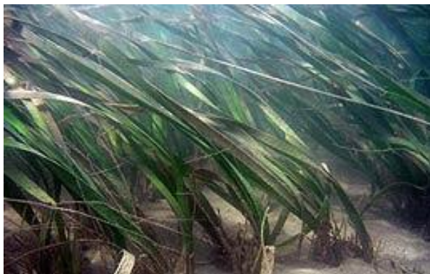
ภาพประกอบที่ 12 หญ้าคาทะเล ( Enhalusacoroides )

บริเวณเกาะเสมสารมีทั้งหมด 4 ชนิด ได้แก่ หญ้าคาทะเล ( Enhalusacoroides ) หญ้าใบมะกรูดแคระ ( Halophila minor ) หญ้าใบมะกรูด ( Halophila ovalis ) หญ้าชะเงาใบฟันเลื่อย ( Cymodoceaserrulata ) (จากการประชุมวิชาการทรัพยากรไทย, 2546)