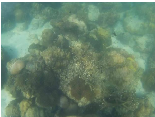
ภาพประกอบที่ 6 ปะการังบริเวณหาดเทียน เกาะแสมสาร อำเภอสัตหีบ จังหวัดชลบุรี

นอกจากปะการังแล้ว บริเวณที่มีกระแสน้ำแรงและตะกอนมาก พบกัลปังหาและแส้ทะเลหลายชนิด โดยเฉพาะกัลปังหาที่พบในบริเวณนี้เป็นรายงานการพบครั้งแรกในอ่าวไทย 3 สกุล ได้แก่ Echinomuricea , Menella และ Dichotella และพบครั้งแรกในประเทศไทย 2 สกุล ได้แก่ Paraplexaura และ Guaiagorgia