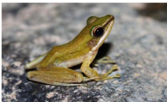
ภาพประกอบที่ 20 กบเขาลงตอง ( Rana choronota )

จากการสำรวจความหลากหลายชนิดของสัตว์สะเทินน้ำสะเทินบกในพื้นที่ของหมู่เกาะแสมสาร พบความหลากหลายชนิดของสัตว์สะเทินน้ำสะเทินบก จำนวน 5 วงศ์ 7 สกุล 8 ชนิด คือ วงศ์คางคก (Buforidae) 1 ชนิด วงศ์กบหนอง (Dicroglossidae) 2 ชนิด วงศ์อึ่งอ่าง (Microhylidae) 3 ชนิด วงศ์กบ (Ranidae) 1 ชนิด และวงศ์ปาด (Rhacophoridae) 1 ชนิด สัตว์สะเทินน้ำสะเทินบกส่วนใหญ่พบใกล้แหล่งน้ำบนเกาะแสมสาร ยกเว้นปาดบ้าน ( Polypedates leucomystax ) พบในห้องน้ำ (พิพิธภัณฑ์ธรรมชาติวิทยา องค์การพิพิธภัณฑ์วิทยาศาสตร์แห่งชาติ, ม.ป.ป.)