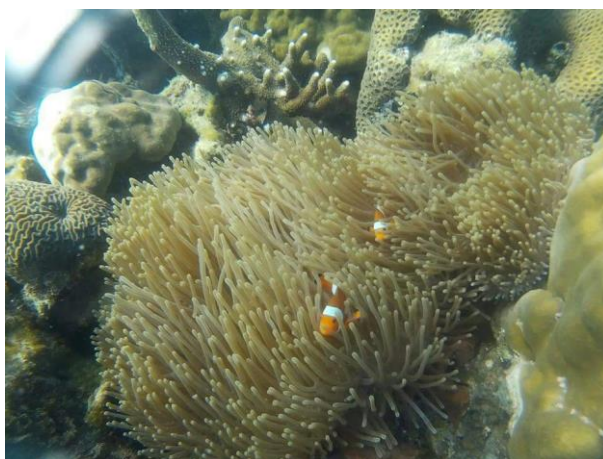
ภาพประกอบที่ 7 ปลาการ์ตูน ( Amphiprionocellaris ) ที่อาศัยอยู่บริเวณปะการังบริเวณหาดเทียน เกาะแสมสาร อำเภอสัตหีบ จังหวัดชลบุรี

สำหรับสิ่งมีชีวิตที่เข้ามาอาศัยหรือใช้ประโยชน์ เช่น ปลา ได้แก่ กลุ่มปลาสลิตหินเป็นปลากลุ่มเด่นในแนวปะการัง โดยเฉพาะปลาสลิตหินเล็ก ( Abudefduf spp.) และปลาสลิตเบงกอล ( Abudefduf bengalensis ) ปลาชนิดอื่นที่พบเป็นกลุ่มปลาที่สามารถพบได้ทั่วไปในแนวปะการังของอ่าวไทย ทั้งปลาการ์ตูน ( Amphiprionocellaris ) ปลาผีเสื้อ ( Chaetodon spp.) ปลานกแก้ว ( Scarus spp.) (สุชานา ชวนิตย์ และ วรณพวิทย์กาญจน์, 2548)