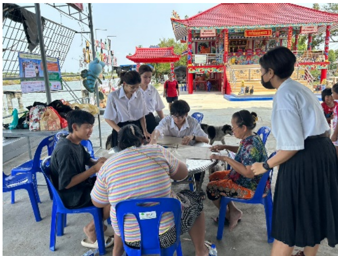
ภาพ 2 การประชุมเชิงปฏิบัติการร่วมกับชุมชนบ้านขุนสมุทรมุขในการออกแบบสินค้าที่ระลึก

ชุมชนเล็งเห็นถึงสาเหตุของการเกิดขยะและวัสดุเหลือใช้ภายในชุมชน จึงให้ความสำคัญกับการลดจำนวนขยะทะเล โดยจากกระบวนการกำจัดขยะที่เดิมที่ยังไม่สามารถสร้างความตระหนักเรื่องปัญหาขยะภายในชุมชนให้นักท่องเที่ยวมากเท่าไรนัก แต่เมื่อมีการนำขยะทะเลมาผลิตเป็นสินค้าที่ระลึก จึงเป็นอีกช่องทางหนึ่งที่สามารถส่งผ่านเรื่องราวของปัญหาขยะภายในชุมชนให้นักท่องเที่ยวได้มากขึ้น โดยชุมชนจะมุ่งสร้างจิตสำนึกให้นักท่องเที่ยวมากกว่าการทำกำไรจากตัวสินค้าที่ระลึก