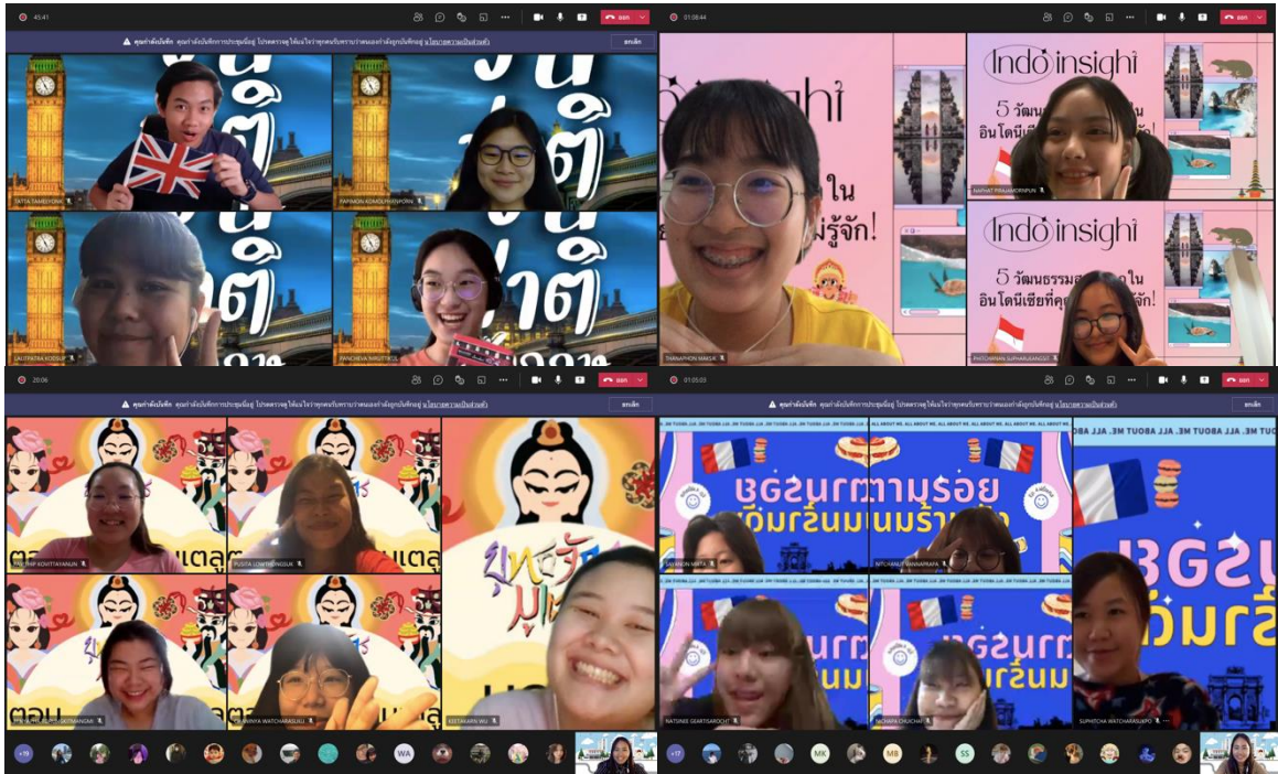
ภาพที่ 3 ตัวอย่างผลงานการนำเสนอผ่านการจัดรายการ Podcast (สัปดาห์ที่ 3)

https://fb.watch/v/SAA6nII7/ , https://fb.watch/v/6GDSDN0qf/ , https://fb.watch/v/31MtvXpLZ/ https://fb.watch/v/_NFAL6XP/