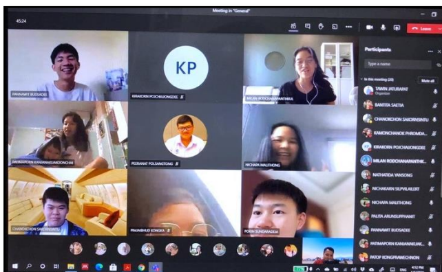
รูปที่ 2 บรรยากาศชั้นเรียนออนไลน์หลังจากการประยุกต์ใช้การจัดการชั้นเรียนแบบ Flipped-classroom

โดยการผสมผสานระหว่างช่องทางการเรียนรู้บทเรียนล่วงหน้าในเว็บไซต์ YouTube มีส่วนช่วยเสริมสร้างบรรยากาศแห่งการเรียนรู้ในชั้นเรียนออนไลน์ รายวิชาภาษาอังกฤษ ผ่านโปรแกรม Microsoft Team เนื่องจากจำนวนชั่วโมงการบรรยายโดยผู้สอนที่เปลี่ยนเป็นชั่วโมงแห่งการแลกเปลี่ยนเรียนรู้ซึ่งกันและกันระหว่างผู้เรียน ก่อให้เกิดพื้นที่แห่งการเรียนรู้มากยิ่งขึ้น และผู้สอนทำหน้าที่ช่วยกำกับดูแล และเสริมความเข้าใจแก่ผู้เรียนทดแทน อย่างไรก็ตามผลจากการศึกษาสังเกตดังกล่าว เป็นเพียงการทดลองปรับปรุง การจัดการเรียนรู้เบื้องต้น ในช่วงวิกฤตการณ์ที่เกิดขึ้นในระบบการศึกษาไทย โดยเฉพาะการจัดการเรียนการสอน รายวิชาภาษาอังกฤษ ที่ผู้เรียนควรได้รับโอกาสและการเสริมสร้างกิจกรรมการเรียนรู้ที่ได้ฝึกฝนและใช้งานทักษะทางภาษา รูปแบบการจัดการเรียนรู้ดังกล่าวมีความจำเป็นในการทดลองทดสอบ และปรับปรุงพัฒนาข้อจำกัดและปัญหาบางประการ ทั้งด้านเนื้อหา ความเหมาะสมเรื่องระยะเวลา รูปแบบการนำเสนอ การจัดการชั้นเรียน และ เสริมแรงผู้เรียน และประเด็นอื่น ๆ ให้มีประสิทธิภาพมากยิ่งขึ้นต่อไปในอนาคต