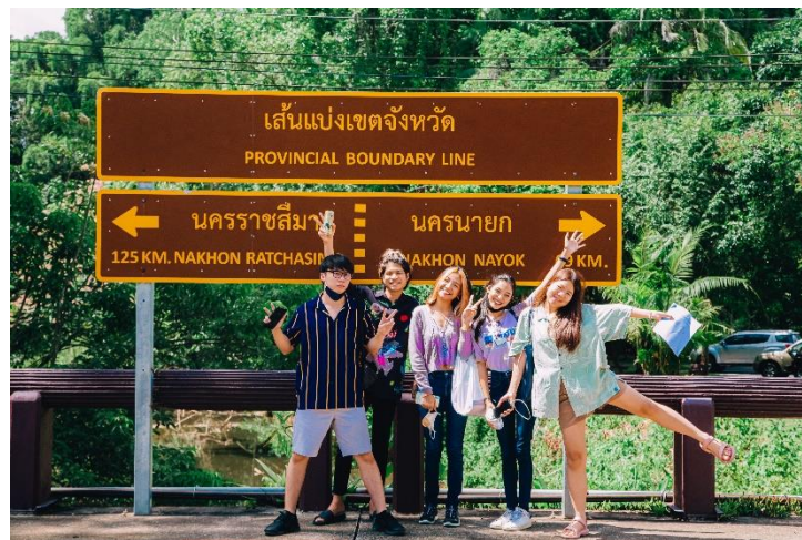
เก็บแบบสอบถาม ณ ลานกางเต็นท์ลำตะคลอง อุทยานแห่งชาติเขาใหญ่ เมื่อเดือนมีนาคม - พฤษภาคม 2565