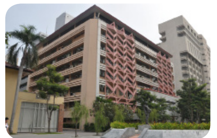
สำนักหอสมุดกลาง ปี พ.ศ. 2558