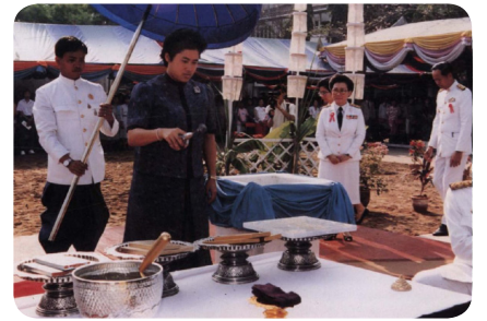
สมเด็จพระเทพรัตนราชสุดาฯ เสด็จพระราชดำเนินมาทรงวางศิลาฤกษ์ “อาคารสมเด็จพระเทพรัตนราชสุดาฯ” เมื่อวันที่ 9 กุมภาพันธ์ 2530

มิถุนายน พ.ศ. 2539 ต่อมาได้รับงบประมาณในการสร้างห้องสมุดหลังใหม่และเปิดให้บริการในเดือนมกราคม พ.ศ. 2541 เป็นต้นมา สำนักหอสมุดกลางใช้ระบบ ห้องสมุดอัตโนมัติและระบบการสืบค้น (SWU Discovery) เพื่อการจัดเก็บและสืบค้นทรัพยากรสารสนเทศร่วมกันภายในเครือข่ายห้องสมุดภายใต้สังกัดมหาวิทยาลัยศรีนครินทรวิโรฒ ได้แก่ ห้องสมุดประสานมิตร ห้องสมุดองครักษ์ ห้องสมุดคณะแพทยศาสตร์องครักษ์ จังหวัดนครนายก ห้องสมุดศูนย์การแพทย์ปัญญานันทภิกขุฯ จังหวัดนนทบุรี และห้องสมุดวิทยาลัยโพธิวิชชาลัย จังหวัดสระแก้ว