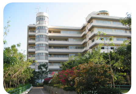
ห้องสมุดองครักษ์ ปี พ.ศ. 2558