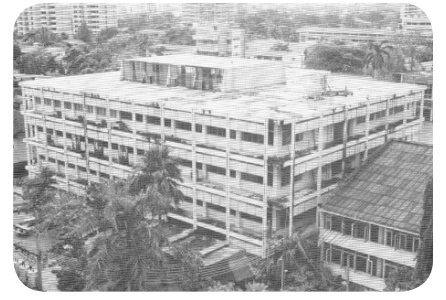
สำนักหอสมุดกลาง วิทยาลัยวิชาการศึกษา พ.ศ. 2517