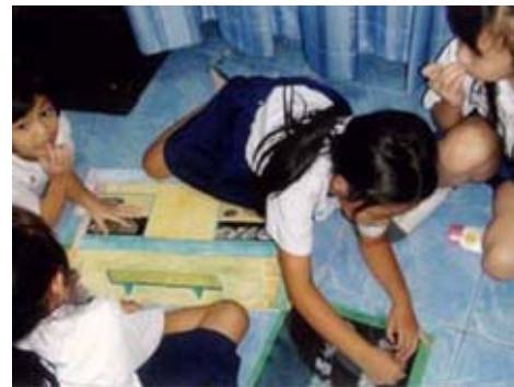
ภาพเด็กนักเรียนกำลังทำกิจกรรมการเล่าเรื่องจากหนังสือภาพ