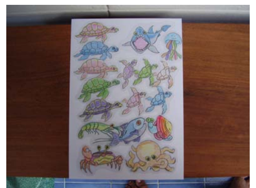
ภาพประกอบของหนังสือภาพและตัวละครเรื่อง "เต่าทะเล"