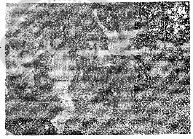
🕟 นิลิต-นิทสิกษาวิทยาลัยวิชาการสิกษา โทร๊องแบลงกรรมดีใจที่จะได้ทกฐานะจั้นเป็นมหาวิทยาลัย