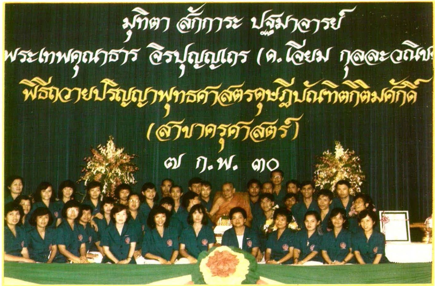
พิธีถวายปริญญาพุทธศาสตรดุษฎีบัณฑิตกิตติมศักดิ์ (สาขาครุศาสตร์) จากสภามหาวิทยาลัย มหาจุฬาลงกรณราชวิทยาลัย ในพระบรมราชูปถัมภ์