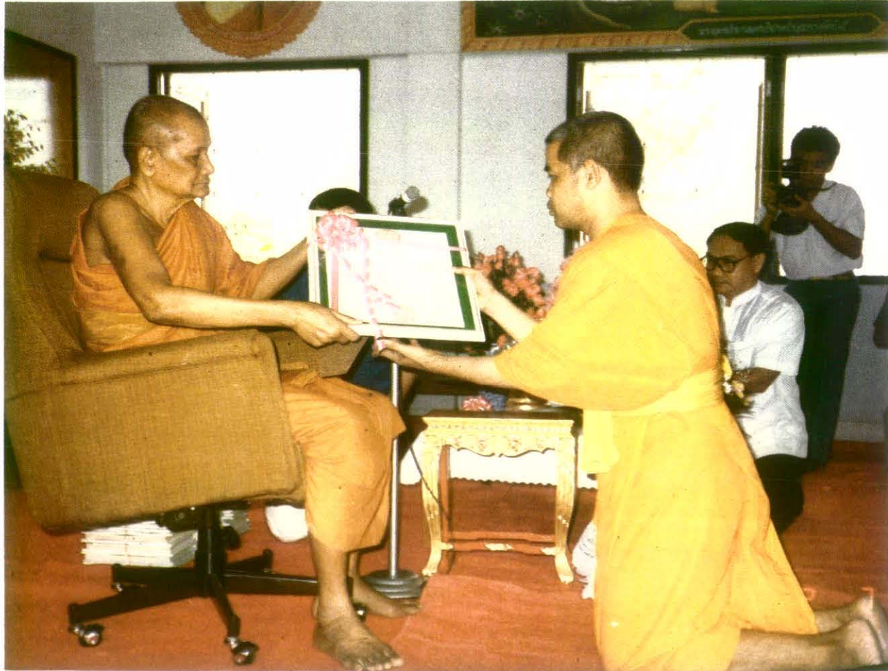
ผู้แทนจากสภามหาวิทยาลัย มหาจุฬาลงกรณราชวิทยาลัย ถวายปริญญาพุทธศาสตรดุษฎีบัณฑิตกิตติมศักดิ์