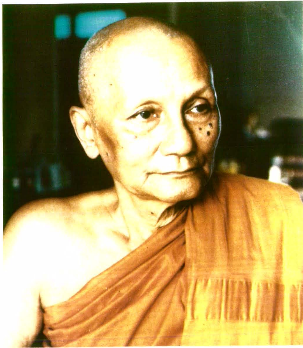
หลวงปู่ พระธรรมเสนาห์