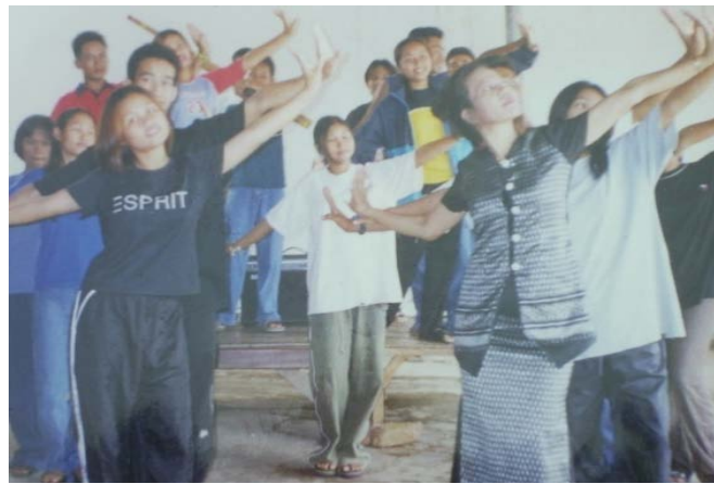
เป็นวิทยากรบรรยายและสาธิตการแสดงหมอลำ