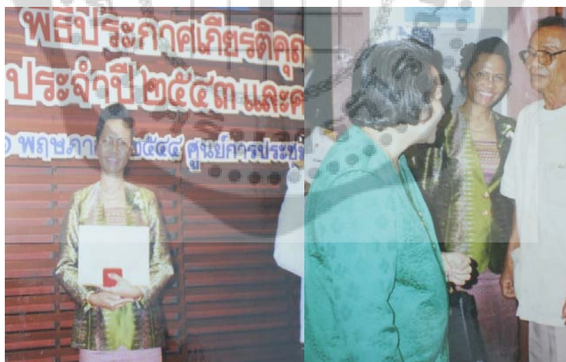
ภาพประกอบ 3 รับรางวัลเข็มเชิดชูเกียรติ จากสำนักงานคณะกรรมการการศึกษาแห่งชาติ