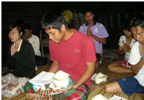
ภาพประกอบ 6 เครื่องบูชาครู