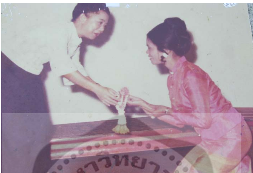
ภาพประกอบ 2 รับพระราชทานรางวัล จากสมเด็จพระนางเจ้ารำไพพรรณี