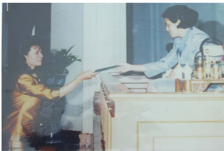
ภาพประกอบ 4 รับพระราชทานรางวัลจาก “สมเด็จพระเทพรัตนราชสุดาสยามบรมราชกุมารี”