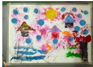
ภาพที่ 7 ผลงานกิจกรรมที่ 7 – เด็กคนที่ 1 ชื่อภาพ บ้านบาร์บี้