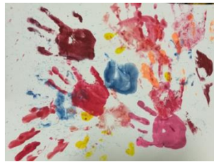
ภาพที่ 1 ผลงานกิจกรรมที่ 1 – เด็กคนที่ 1 ชื่อภาพ มือหนู