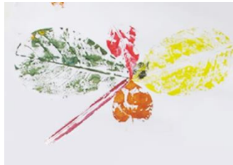
ภาพที่ 2 ผลงานกิจกรรมที่ 2 – เด็กคนที่ 1 ชื่อภาพ แมลงปอของหนู