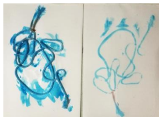
ภาพที่ 4 ผลงานกิจกรรมที่ 4 – เด็กคนที่ 1 ชื่อภาพ Elephant