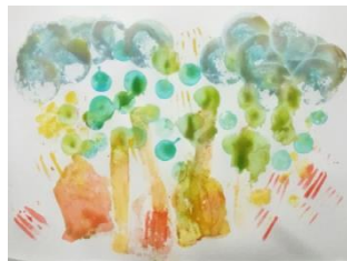
ภาพที่ 3 ผลงานกิจกรรมที่ 3 – เด็กคนที่ 8 ชื่อภาพ ปากกว้าง