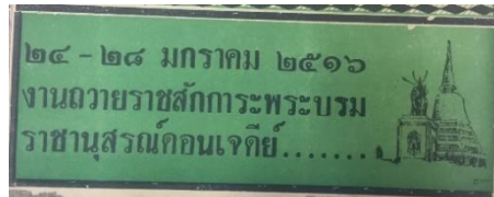
รูป 1 โฆษณางานอนุสรณ์ดอนเจดีย์หัวมุมขวามือของหน้า 1 พ.ศ. 2516 โดยจะพบว่ามีกรอบโฆษณาในลักษณะนี้ต่อมาก่อนจะเปลี่ยนรูปแบบเป็นรูปโปสเตอร์งานและพาดหัวข่าวในฉบับเดือนธันวาคม พ.ศ. 2523

จากการตรวจสอบข่าวที่เกี่ยวกับงานอนุสรณ์ดอนเจดีย์พบว่าวันเวลาการจัดงานช่วงแรกจะมีการจัดงาน 3 วันคือตั้งแต่วันที่ 24-26 มกราคมการแสดงประกอบไปด้วยดนตรีของ 3 กองทัพ ภาพยนตร์ รำวง และการแสดงวิวัฒนาการทางอาวุธของกองทัพบก ฯลฯ (คนสุพรรณ, 2509, 25 มกราคม, น. 15.) นอกจากนี้ยังมีการออกร้านค้าของประชาชน การจัดงานในช่วงแรกการประชาสัมพันธ์ถึงงานที่จัดยังไม่แพร่หลายมากนัก สังเกตได้จากโฆษณาในหนังสือพิมพ์ท้องถิ่นคนสุพรรณพบว่ามีข้อความโฆษณางานเพียงชิ้นเดียวในวันที่ 25 มกราคม ปี 2509 ซึ่งเป็นกรอบโฆษณาเล็กๆ ไม่สะดุดตาในหนังสือพิมพ์หน้า 15 ก่อนที่จะพบโฆษณางานอนุสรณ์ดอนเจดีย์อีกครั้งในเดือนมกราคมปี 2516 โดยระบุไว้ในหัวมุมด้านบนขวามือของหนังสือพิมพ์หน้าแรก และมีรายละเอียดการเพิ่มวันจัดงานเป็นวันที่ 24-28 มกราคม (คนสุพรรณ, 2516, 20 มกราคม, น. 1.) ดังรูปที่ 1 และในหนังสือพิมพ์ฉบับนี้ก็ถือเป็นฉบับแรกที่มีโฆษณาร้านค้าที่ม้อออกร้านในงานอนุสรณ์ดอนเจดีย์ด้วยดังรูปที่ 2 การเพิ่มวันจัดงานและมีโฆษณาร้านค้าแสดงให้เห็นว่างานอนุสรณ์ดอนเจดีย์ได้รับความนิยมจากประชาชนทั่วไปมากขึ้น และการที่หนังสือพิมพ์ท้องถิ่นนำเสนอโฆษณางานในหน้า 1 อาจมองได้ในแง่ของการพยายามแสดงความเป็นเจ้าของในพื้นที่ ขณะเกิดเหตุการณ์ช่วงชิงพื้นที่ประวัติศาสตร์ตำแหน่งการยุทธหัตถีที่แท้จริงกับกาญจนบุรีที่เริ่มเป็นข่าวเกรียวกราวตั้งแต่ปี 2515