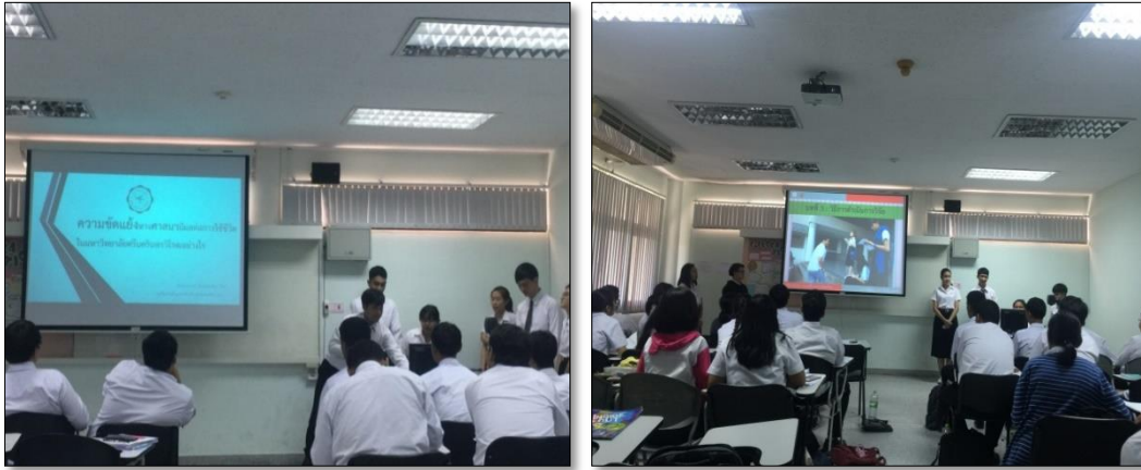
ภาพประกอบการวิจัยการจัดการเรียนการสอนโดยใช้วิจัยเป็นฐาน