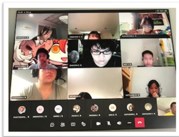
ภาพที่ 3 เส้นทางการที่ฉันเลือกเอง

สำหรับเส้นทางการเลือกเรียนรายวิชาเพิ่มเติมเลือก กลุ่ม 1 ที่มีถึง 16 รายวิชา โดยคุณครูผู้สอนสามารถทดลองสอนเพียง 1 คาบ 50 นาที น่าจะต้องใช้ ยุทธศาสตร์ เทคนิค ทฤษฎีจิตวิทยาเป็นอันมาก เพื่อที่จะได้นักเรียน ที่จะเลือกเรียนในรายวิชาของตนเอง แต่ในที่สุดแล้ว ก็มีเพียงแต่นักเรียนคงจะต้องเลือกเส้นทางการที่ฉันเลือกเอง สัก 1 วิชา เพื่อที่จะเรียนต่อเนื่อง ไปตลอด 1 ปีการศึกษา หรือ 3 ปีการศึกษาต่อเนื่อง