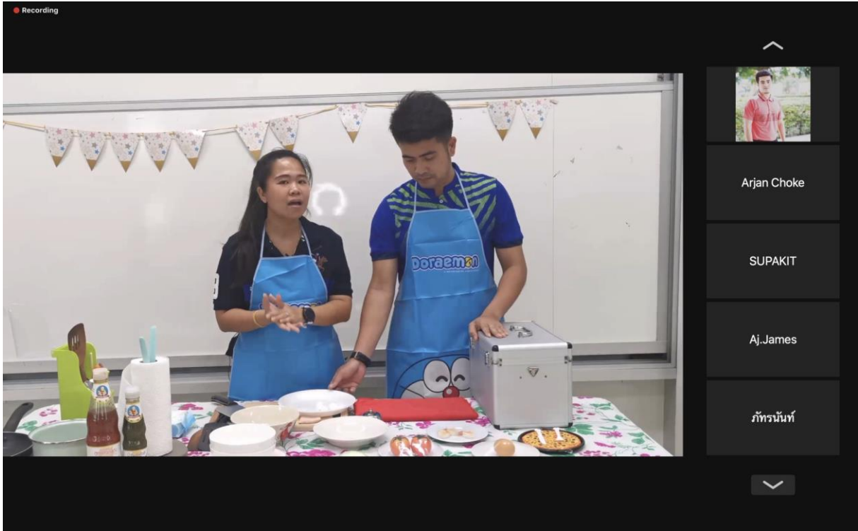
ภาพที่ 10 การจัดกิจกรรมบริการวิชาการรูปแบบออนไลน์