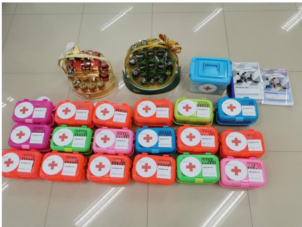
ภาพที่ 4 อุปกรณ์กล่องปฐมพยาบาล